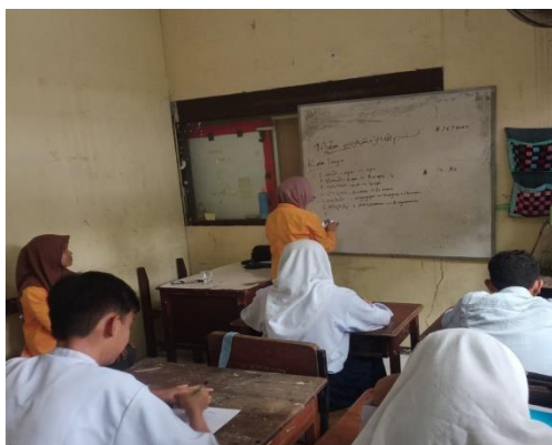
Gambar 1. Keterampilan Menulis

Hartini et al., (2021) Kemandirian belajar dapat dilihat dari kegiatan belajarnya, dia tidak perlu disuruh bila belajar dan kegiatan belajar dilaksanakan atas inisiatif dirinya sendiri. Hal-hal yang mempengaruhi kemandirian belajar antara lain : disiplin, percaya diri, motivasi, inisiatif, dan tanggung jawab. Pada kegiatan ini, kemandirian yang di tingkatkan lebih fokus kepada bagaimana agar supaya anak anak bisa melakukan sesuatu yang sudah di ajarkan dengan mandiri seperti halnya menulis, menggambar, berinteraksi dengan teman temannya, dan lain sebagainya. Mereka yang berkebutuhan khusus ketika dipaksakan untuk bisa mandiri dengan cepat tentu adalah pemikiran yang kurang tepat karena kenyataannya mereka yang berkebutuhan khusus atau mempunyai keunikan sangat sulit untuk fokus dan berpikir, meskipun demikian mencoba untuk menciptakan hal itu bukanlah hal yang mustahil dan sangat perlu dilakukan karena meningkatkan kemandirian anak anak berkebutuhan khusus adalah jalan untuk memberi pandangan masa depan yang cerah kepada mereka.