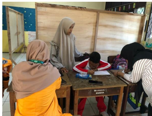
Gambar 2. Keterampilan Menggambar