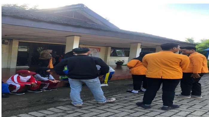
Gambar 3. Interaksi