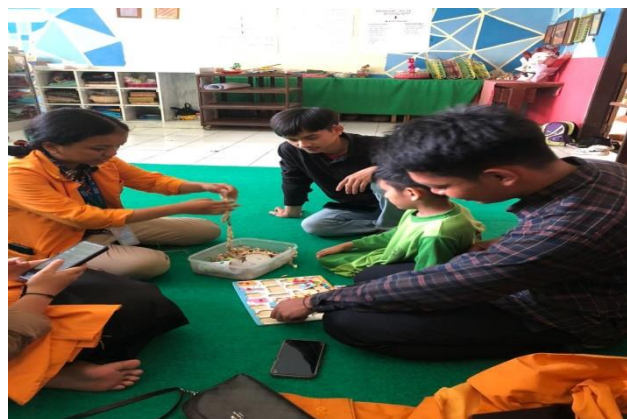
Gambar 6. Hantaran

Semua kegiatan yang dilakukan di atas adalah sebuah langkah untuk meningkatkan kemandirian dan keterampilan siswa untuk bisa menghadapi hidup lebih baik kedepannya. Sebuah perubahan muncul karena ada usaha sedangkan usaha muncul dari kemauan yang tinggi dan kemauan yang tinggi atau motivasi yang tinggi akan hadir ketika ada sebuah bayangan yang selalu dilihat dan menggerakkan perasaan untuk bertindak. Semua kegiatan yang dilakukan sebagai orang baru di lingkungan ini mendapat kehangatan dari kebaikan dan keceriaan siswa, guru dan orang tua, hal seperti inilah yang menjadi harapan dan jalan untuk bisa memberikan sumbangsi dengan penuh kegembiraan dan kenyamanan.