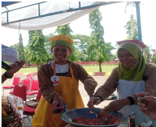
Gambar 4. Lomba Masak

prgram yang sudah ada dan di jalankan oleh tim pengabdi adalah ekstrakurikuler. Dari Miftakhi, h.2 (2020) mengatakan bahwa ekstrakurikuler adalah kegiatan yang dilakukan di luar jam pelajaran dengan tujuan untuk memperluas pengetahuan siswa. Dari pendapat itu dapat di simpulkan bahwa esktrakurikuler sangat cocok untuk meningkatkan keterampilan siswa khususnya siswa yang ada di SLBN 2 Makassar. Oleh karena itu, dengan fasilitas yang ada maka tim pengabdi mengadakan berbagai kegiatan untuk menunjang kebutuhan tersebut, diantara kegiatannya adalah diadakannya lomba masak, latihan menjahit, pегhijauan di lingkungan sekolah, hantaran, dan masih banyak lagi.