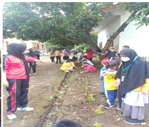
Gambar 5. Penghijauan