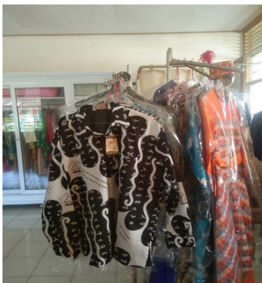
Gambar 3. Keterampilan Menjahit

Selain karya siswa dipajang pada event pameran, karya siswa juga dijual. Apabila ada pengunjung yang berminat untuk membeli, maka produk yang pameran tersebut dijual sehingga hasil yang didapat dari karya tersebut dikembalikan untuk kebutuhan alat dan bahan dalam pembuatan produk. Namun, untuk kepentingan lomba, produk yang telah terjual biasanya di produksi kembali. Jika bahan dan alat yang disediakan sendiri oleh siswa, maka hasil dari pembuatan produk dikembalikan ke siswa lagi. Sebaliknya, jika alat dan bahan disediakan oleh sekolah, maka hasil produknya juga digunakan untuk keperluan perlombaan atau yang akan dipamerkan di pameran nanti.