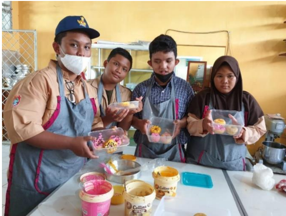
Gambar 5. Siswa sedang Praktek Membuat Donat (Tata Boga)

tingkat Nasional. Biasanya juga terdapat kunjungan dari orang-orang penting untuk melihat pelatihan pembuatan masakan dari penyandang disabilitas secara langsung.