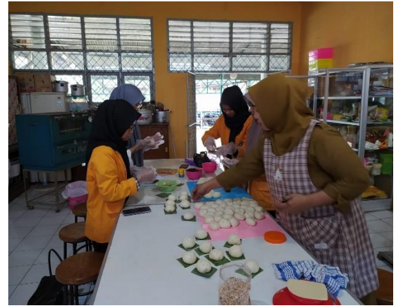
Gambar 6. Membuat Roti Pawa untuk Dijual