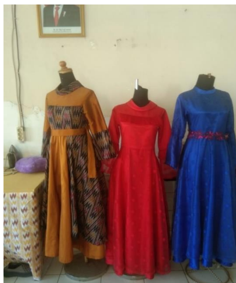
Gambar 4. Hasil Jahitan Siswa

Sedangkan hasil pada pelatihan Tata Boga adalah terdapat salah satu alumni SLB 1 Makassar yang membuka usaha sendiri dengan nama cafe 'Cafe Tuli'. Selebihnya, alumni yang lain sebagian bekerja di tempat kuliner salah satunya 'Burger King'. Adapun, dalam perlombaan biasanya mewakili hingga