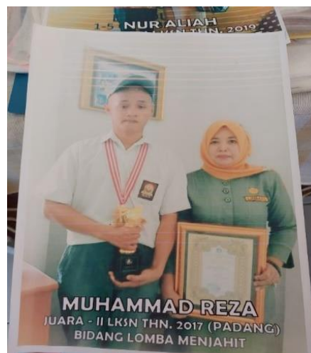
Gambar 2. Lomba Tingkat Nasional (Tata Busana)

Selain karya siswa dipajang pada event pameran, karya siswa juga dijual. Apabila ada pengunjung yang berminat untuk membeli, maka produk yang pameran tersebut dijual sehingga hasil yang didapat dari karya tersebut dikembalikan untuk kebutuhan alat dan bahan dalam pembuatan produk. Namun, untuk kepentingan lomba, produk yang telah terjual biasanya di produksi kembali. Jika bahan dan alat yang disediakan sendiri oleh siswa, maka hasil dari pembuatan produk dikembalikan ke siswa lagi. Sebaliknya, jika alat dan bahan disediakan oleh sekolah, maka hasil produknya juga digunakan untuk keperluan perlombaan atau yang akan dipamerkan di pameran nanti.