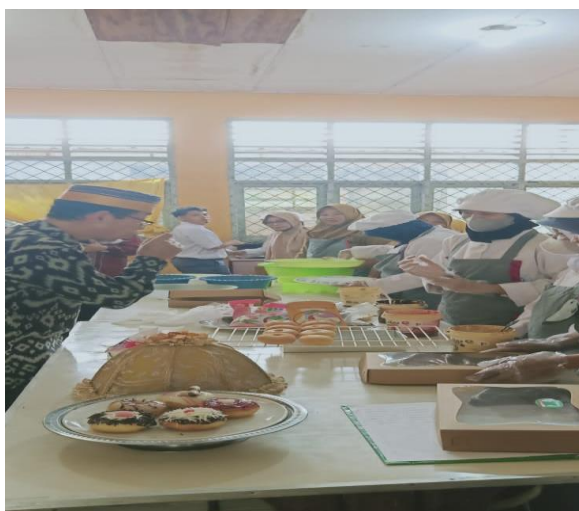
Gambar 7. Siswa Bimbingan Tata Boga Mengikuti Lomba