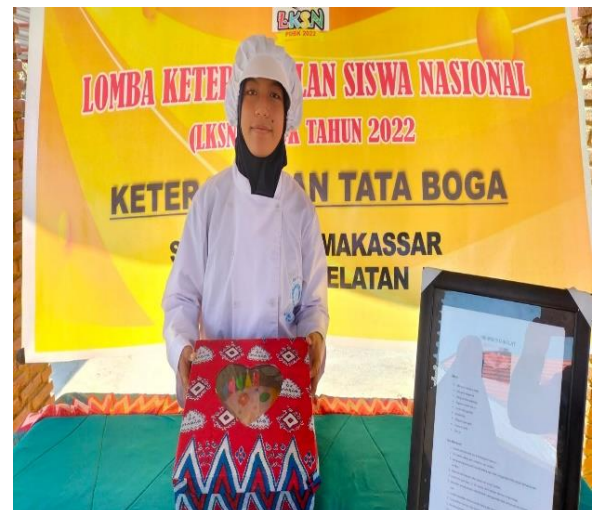
Gambar 8. Siswa Mengikuti Lomba Tingkat Nasional

Penunjang keberhasilan pelatihan dilengkapi berbagai upaya kolaborasi dan kerja sama dengan lingkungan internal dan eksternal yaitu adanya komunikasi yang baik dan kerja sama yang baik antara pembina keterampilan dan orangtua siswa. Adanya kemauan siswa untuk mengembangkan dirinya dan mampu menghadapi segala masalah maupun hambatan yang dihadapi, serta siswa bisa diajak bekerja sama dalam pelatihan. Majid (2019) menyatakan bahwa terdapat tolak ukur atau parameter manusia benar-benar patut diberdayakan. Parameter tersebut terdiri atas, adanya tingkat kesadaran dan kemauan seseorang atau pun kelompok untuk tumbuh, memiliki kemampuan guna meningkatkan kapasitas dalam aksesibilitas, mampu menghadapi hambatan, dan adanya kemampuan dalam membangun kerja sama.