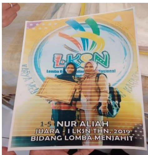
Gambar 1. Lomba Tingkat Nasional (Tata Busana)