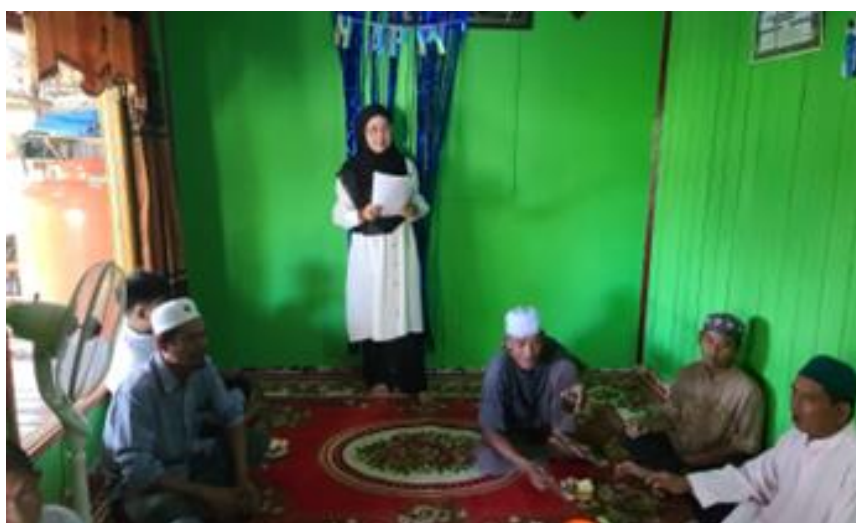
Gambar 2. Penyuluhan Manajemen Pelayanan Prima

Berdasarkan hasil komunikasi dengan mitra, maka dalam tahapan pelaksanaan yang dilakukan meliputi kegiatan sosialisasi dan penyuluhan, kemudian diskusi interaktif serta memberikan pendampingan dalam pelaksanaan manajemen pelayanan prima. Kegiatan penyuluhan, pemberian materi yang kemudian dilanjutkan dengan diskusi ini adalah untuk menyampaikan pengetahuan serta pemahaman tentang konsep dan arti penting