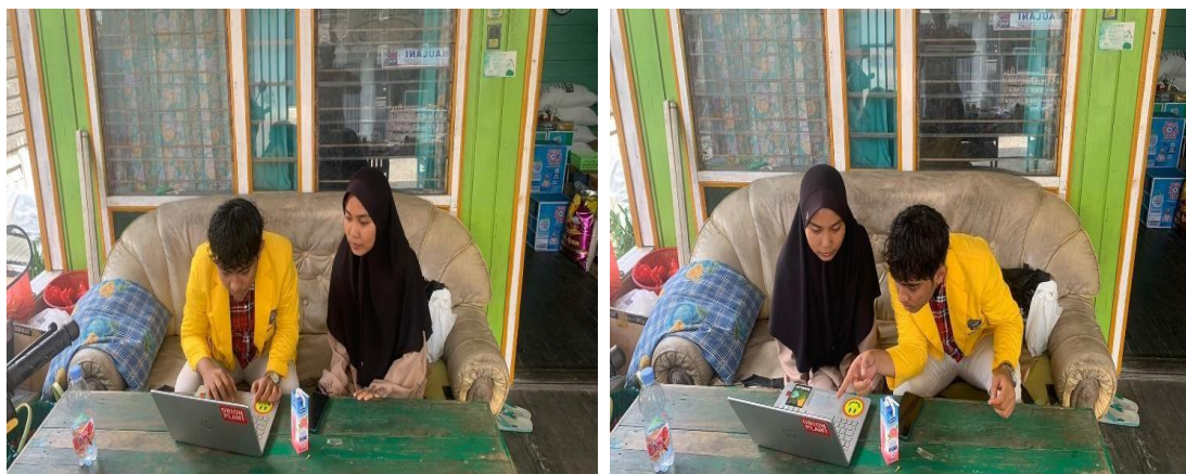
Gambar 3. Kegiatan Pendampingan

Adapun dokumentasi pembimbingan dari pencatatan arus kas diatas yang dilakukan oleh peneliti dan peserta pelatihan sebagai berikut: