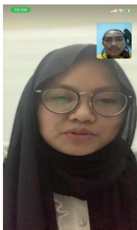
Gambar 2. Sesi Tanya Jawab Via Video Call