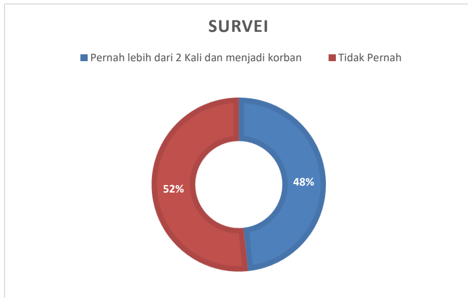
Gambar 5. Wawancara/Survei Siswa

menyatakan pernah lebih dari 2 kali melakukan perundungan melalui media sosial, dan sekaligus pernah mengalaminya. Sebanyak 48% mengaku tidak pernah melakukan perundungan via media sosial.