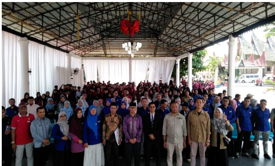
Gambar 4. Analisis Situasi Lapangan Bersama Stakeholder

Disamping itu, pada tahap ini juga bertujuan untuk melakukan consensus terhadap jadwal pelaksanaan pengabdian. Secara spesifik kegiatan ini terdiri dari koordinasi perosalan cyberbullying di MAN 1 Kabupaten Tanah Datar, menyepakati jadwal pelaksanaan pengabdian, serta melakukan identifikasi dan persiapan internal pengabdian (perlengkapan, materi dan penunjang).