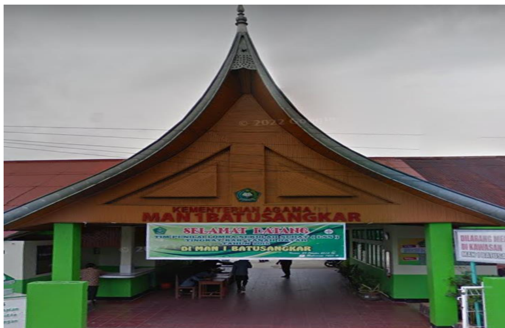
Gambar 2. MAN 1 Kabupaten Tanah Datar

Pengabdian ini tentu menyasar siswa-siswa MAN 1 Kabupaten Tanah Datar. Adanya pelatihan, pengabdian, dan diskusi mengenai cyberbullying ini diharapkan mampu meningkatkan literasi siswa-siswa. Sehingga, pelatihan dan pendampingan ini diharapkan mampu menjadi salah satu upaya pencegahan dan peningkatan kesadaran terhadap pencegahan cyberbullying . Berikut dokumentasi dari tempat pelaksanaan pengabdian ini.