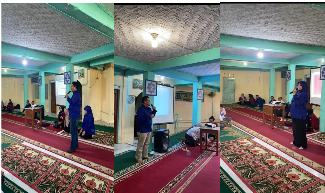
Gambar 6. Penyampaian Materi Pengabdian

Di dalam proses penyampaian materi pada sosialisasi pengabdian ini, para siswa sangat antusias menyimak penjabaran dari para narasumber. Tidak terkecuali bagi para guru juga ikut antusias melihat praktek-praktek penegakan hukum dan fenomena penyimpangan hukum yang diakibatkan oleh cyberbullying tersebut. Mereka cukup menyadari bahwa tindak pidana ini tidak disebabkan oleh faktor tunggal, melainkan plural.