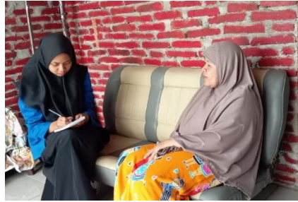
Gambar 5. Pelatihan Perhitungan PPh Final UMKM