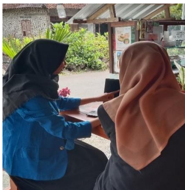
Gambar 4. Sosialisasi Perpajakan dan PPh Final

Hasil yang didapat pada tahap ini berupa peningkatan kesadaran pelaku UMKM akan pentingnya perpajakan dan implikasinya terhadap perkembangan usaha mereka. Kemudian, pemahaman pelaku UMKM mengenai jenis pajak yang harus mereka bayarkan dan mekanisme PPh Final UMKM mengalami peningkatan. Peningkatan kesadaran dan pengetahuan perpajakan di kalangan pelaku UMKM merupakan Langkah positif dalam mendukung pertumbuhan sektor UMKM secara keseluruhan. Dengan pemahaman yang lebih baik tentang peraturan perpajakan, pelaku UMKM dapat mengelola keuangan mereka dengan lebih efektif dan dapat memberikan kontribusi yang lebih besar pada perekonomian nasional. Berikut adalah catatan visual dari kegiatan yang dilakukan: