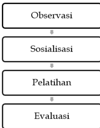
Gambar 3. Tahap-tahap pelaksanaan pengabdian

Pelaku UMKM yang akan dilakukan penambahan pengetahuan perpajakan melalui pendampingan masyarakat berada di Desa Wonokerto. Tujuan dari kegiatan ini adalah melibatkan dua mitra, yakni pelaku UMKM di Desa Wonokerto. Kedua mitra memiliki usaha yang berbeda yaitu usaha kuliner dan toko kelontong. Nama usaha dari kedua mitra tersebut adalah Dafa Pramuka dan Serenity Boba. Para pelaku UMKM tersebut sudah menjalankan usahanya selama lebih dari 1 tahun. Pelaksanaan kegiatan pengabdian ini berlangsung di tempat usaha mitra yang dituju, dengan mengunjungi mitra secara individual. Pelaksanaan kegiatan dilaksanakan selama 1 bulan dengan pertemuan sebanyak 5 kali. yaitu pada tanggal 5, 17, 24 September 2023 serta 3, 5 Oktober 2023. Berikut adalah tahap-tahap pelaksanaan pengabdian: