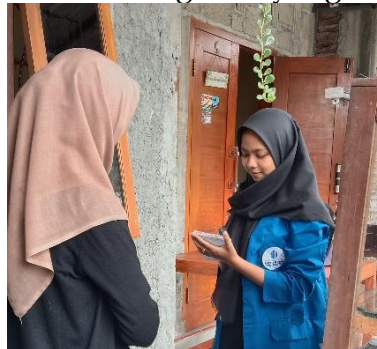
Gambar 6. Sosialisasi dan Pelatihan Pembuatan NPWP

Hasil yang didapat pada tahap ini berupa keberhasilan memberikan dampak positif dalam meningkatkan kesadaran dan keterampilan pelaku UMKM. Dengan pemahaman yang lebih baik tentang pentingnya NPWP, diharapkan pelaku UMKM dapat menjalankan usaha mereka dengan lebih terstruktur dan dapat mematuhi kewajiban perpajakan dengan lebih baik. Berikut adalah catatan visual dari kegiatan yang dilakukan: