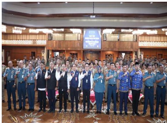
Gambar 5 Pembekalan SekWilda Provinsi Jawa Timur pada 29 November 2023