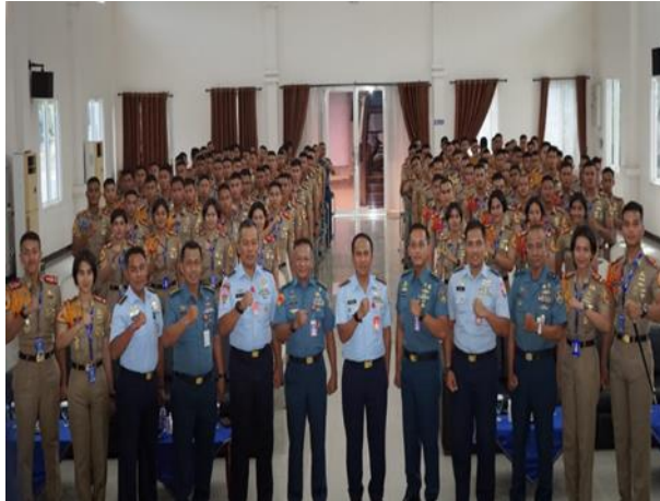
Gambar 12 Pembekalan yang diberikan Danlanud Surabaya pada 30 November 2023