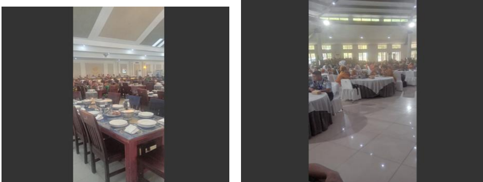
Gambar 18 Suasana Makan Siang Taruna AAL Bersama Mahasiswa Perguruan Tinggi Lain