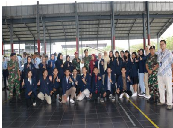
Gambar 13 Gubernur AAL, TNI AL, Dosen Pendamping dan Mahasiswa dari Universitas Negeri Surabaya