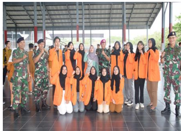
Gambar 14 Gubernur AAL, TNI AL, Dosen Pendamping, dan Mahasiswa Universitas Internasional Semen Indonesia