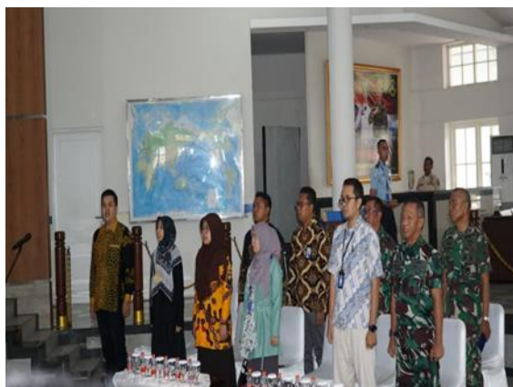
Gambar 6 Menyanyikan Lagu Indonesia Raya Sebelum Acara pada 01 Desember 2023