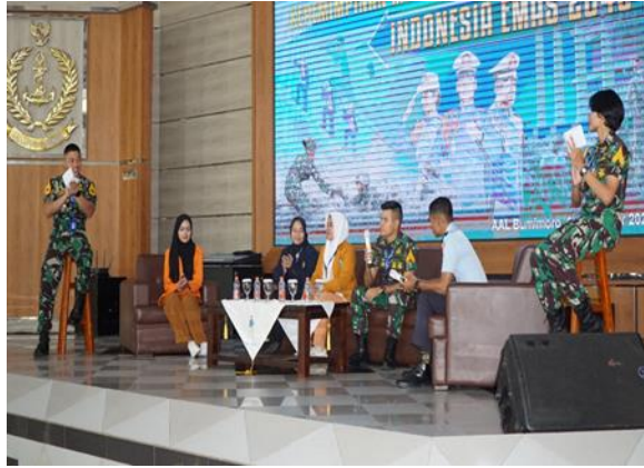
Gambar 8 Mahasiswa Perguruan Tinggi yang Diundang Bersama Taruna AAL Saat Sarasehan