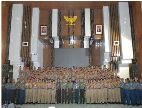
Gambar 3 Pembekalan Pangdam V Brawijaya Surabaya Bersama Taruna Politeknik Angkatan Laut pada 28 November 2023