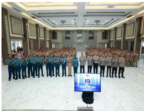
Gambar 4 Pembekalan dari Kapolda Jawa Timur pada 28 November 2023