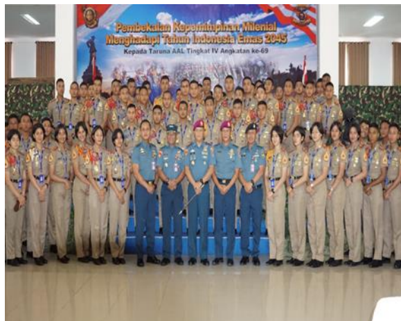
Gambar 11 Pembekalan Dan Pasmar 2 Bersama Taruna Politeknik Angkatan Laut (AAL) pada 30 November 2023