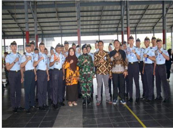
Gambar 15 TNI AL, Dosen Pendamping serta Mahasiswa Politeknik Kelautan dan Perikanan