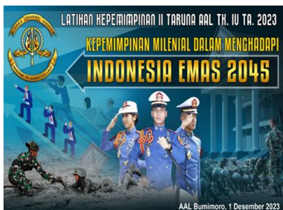
Gambar 1 Banner Latihan Kepemimpinan II Taruna AAL TK. II TA. 2023

Pada pelaksanaan kegiatan latihan kepemimpinan II Taruna Politeknik Angkatan Laut Tk. IV Angkatan Ke-69 Tahun 2023 dengan tema yang dibawakan oleh Narasumber yaitu “Kesempatan Emas Menuju Indonesia Emas 2045”, peserta kegiatan pelatihan kepemimpinan mencakup taruna Politeknik Angkatan Laut, dosen pendamping dan mahasiswa dari Universitas Internasional Semen Indonesia, Universitas Negeri Surabaya, Politeknik Kelautan dan Perikanan dan Akademi Farmasi Yannas Husada Bangkalan ditempatkan pada ruangan gedung Maspardi Politeknik Angkatan Laut di Surabaya dalam puncak acara tanggal 01 Desember 2023. Kegiatan pelatihan kepemimpinan ini dilakukan untuk memperluas pandangan, pemahaman dan sifat kritis generasi muda (generasi milenial) sebagai calon pemimpin Indonesia di masa depan sehingga dapat berlaku secara tepat, cepat, efisien dan bijaksana dalam mewujudkan visi Indonesia Emas 2045. Berdasarkan kegiatan pelatihan kepemimpinan ini, seluruh peserta meliputi taruna Politeknik Angkatan Laut, dosen pendamping dan mahasiswa dari Universitas Internasional Semen Indonesia, Universitas Negeri Surabaya, Politeknik Kelautan dan Perikanan dan Akademi Farmasi Yannas Husada Bangkalan sangat fokus dan antusias dalam menjalani atau mengikuti serangkaian jadwal yang telah diberikan. Beberapa dokumentasi terkait proses kegiatan latihan kepemimpinan II Taruna Politeknik Angkatan Laut Tk. IV Angkatan Ke-69 Tahun 2023 ditunjukkan pada gambar berikut.