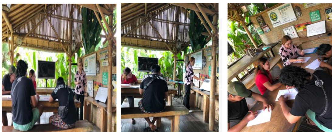
Gambar 4. Kegiatan PKM Tahap 2 Penyampaian Materi Bahasa Inggris Dasar Bagian 2