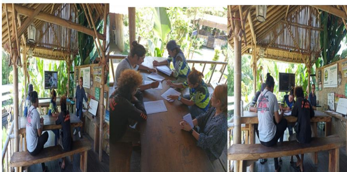
Gambar 3. Kegiatan PKM Tahap I Penyampaian Materi Bahasa Inggris Dasar Bagian 1