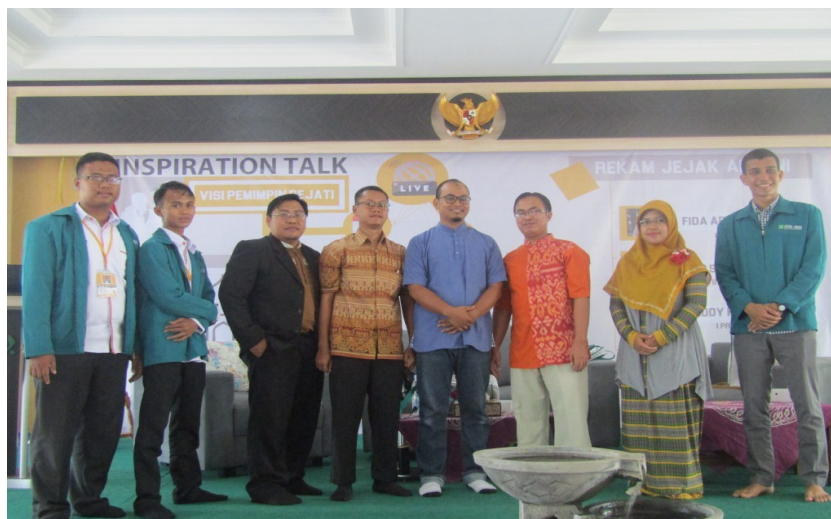
Gambar 4. Foto bersama