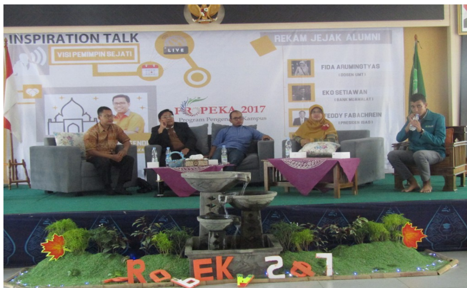
Gambar 2. Narasumber sedang memberikan pemaparan

Muslim memiliki posisi yang strategis. Posisi strategis itu tidak hanya untuk konteks nasional, tetapi juga internasional. Muslim milenial dapat mengangkat citra Islam Indonesia agar menjadi rujukan dunia dalam mewujudkan masyarakat yang damai dan berkeadaban (Iswanto, 2018).