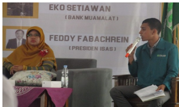
Gambar 3. Sesi Diskusi

Sesi terakhir dari rangkaian acara adalah sesi diskusi, dalam sesi ini para peserta acara diperbolehkan menanyakan pertanyaan terhadap narasumber terkait pemaparan yang telah dijelaskan.