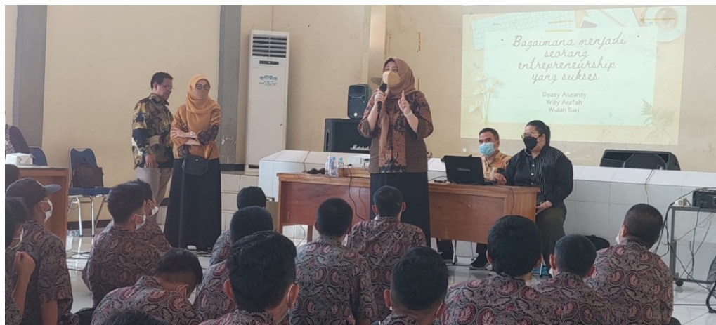
Gambar 5. Memberi penyuluhan pada anak-anak di panti sosial

Lalu di tahapan selanjutnya yaitu tanggal 14 Februari 2022 pihak FEB Usakti bertemu langsung dengan anak-anak di panti sosial (WBS) untuk mendata dan melihat langsung mereka, berbicara sambil mengenal mereka dan sekaligus memberikan penyuluhan kepada mereka. Ini pun dilakukan secara offline .