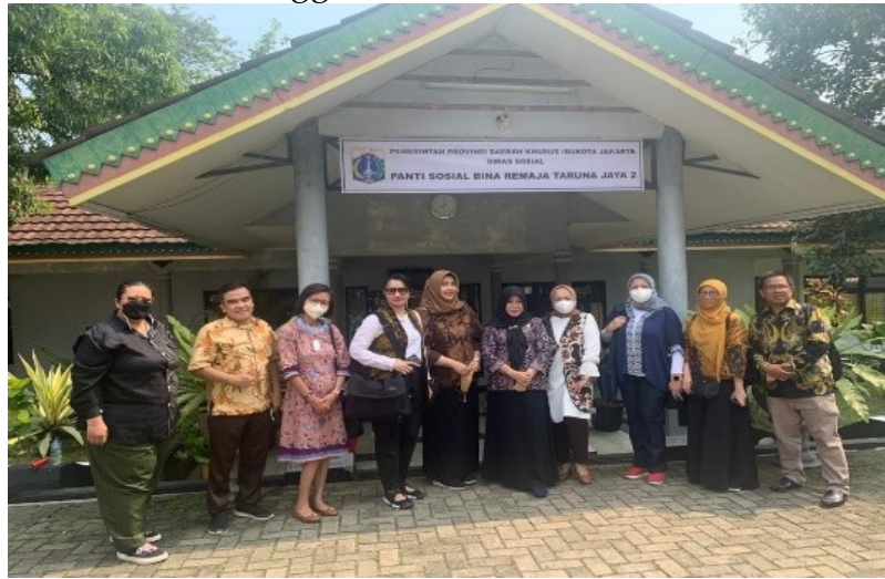
Gambar 4. Pertemuan FEB Universitas Trisakti dengan pengelola panti sosial

Pelaksanaan kegiatan diawali dengan pertemuan antara pihak FEB Universitas Trisakti dengan pihak pengelola panti sosial secara offline di panti sosial. Ini dilaksanakan di tanggal 16 November 2021