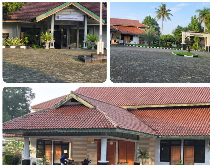
Gambar 1. Panti Sosial Bina Remaja Taruna II

Tiap orang memiliki hak untuk menjadi seorang wirausahawan. Menjadi seorang wirausahawan memerlukan niat yang baik. Niat ini perlu disertai dengan dorongan, disertai dengan upaya yang sungguh-sungguh untuk menjalankan peran dan fungsi seorang wirausahawan. Seorang wirausahawan sebaiknya memiliki karakter, ciri kepribadian yang dapat mendukung untuk menjadi seorang wirausahawan yang baik. Tidak ada bisnis yang tanpa masalah, dan sebagai wirausahawan perlu keterampilan khusus untuk dapat menyelesaikan masalah juga membuat keputusan. Perlu kesungguhan dan komitmen. Perlu meminimalisasi atau menghilangkan kesalahan. Apabila hal ini semuanya bisa dilakukan, maka seorang wirausahawan akan sukses. Menjadi wirausahawan yang sukses tentu menjadi dambaan para pelaku bisnis, yang mana kesuksesan ini bisa mewujudkan bisnis yang berkelanjutan. Hal ini secara tidak langsung meningkatkan kesejahteraan masyarakat yang dapat mempengaruhi pencapaian tujuan nasional.