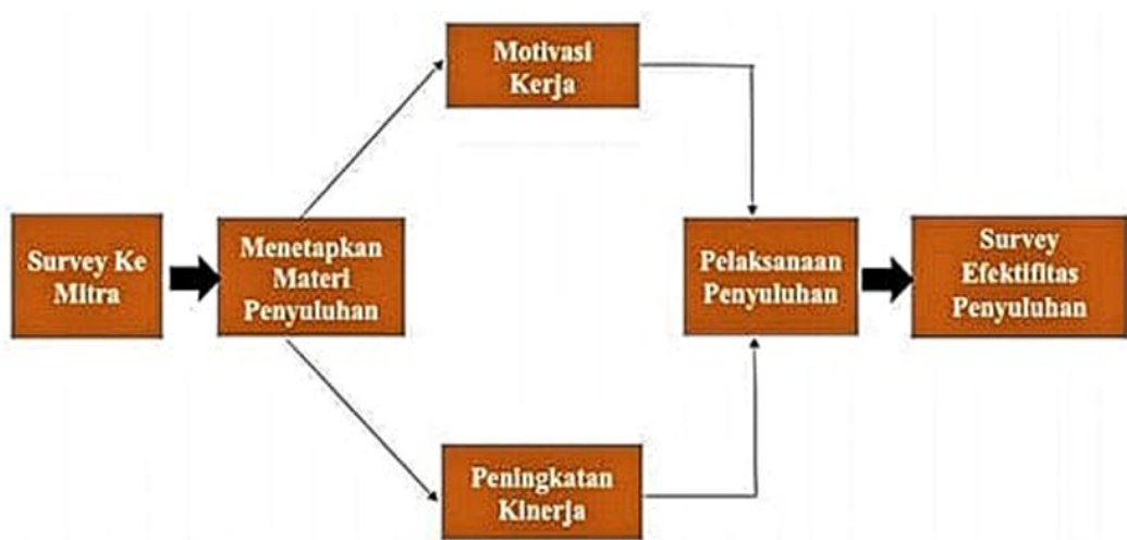
Gambar 3. Kerangka persiapan kerja