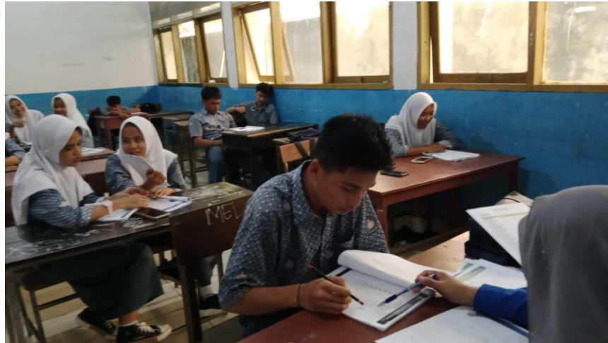
Gambar 2. Kegiatan Mengenal huruf-huruf hijaiyyah menggunakan buku pedoman yang sudah di sediakan pihak sekolah

Melalui kegiatan ini Siswa diharapkan untuk mengembangkan karakter yang lebih religius dan bermoral tinggi dengan mengikuti kegiatan ibadah. Menurut (Wahid dkk. 2011) Rabbaniyah menggambarkan karakter yang religious mengandung nilai-nilai keimanan, kebaikan, ketaqwaan, kejujuran, amanah, syukur dan kesabaran. Adapun nilai-nilai kemanusiaan menyangkut hal-hal sebagai berikut: persahabatan, persaudaraan, rasa kesetaraan, rasa keadilan, keramahan, kerendahan hati, menepati janji dan pikiran terbuka, kejujuran, keteguhan, kemewahan, kelembutan. Melalui kegiatan ini siswa karakter religious siswa dapat terbentuk dengan baik dan menjadi pola hidup berperilaku.