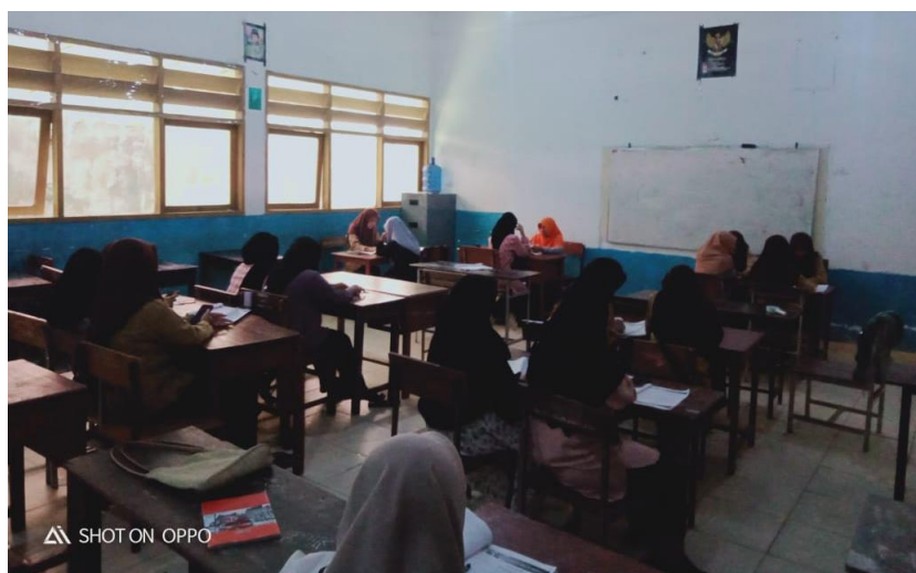
Gambar 1. Suasana Siswa belajar mengaji dengan cara private

Selain siswa diajarkan membaca al-quran secara private, hal ini membantu siswa memperoleh pemahaman yang lebih baik tentang ajaran agama Islam dan bagaimana mereka dapat menerapkannya dalam kehidupan sehari-hari (Sistem Madrasah)