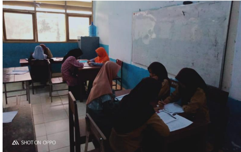
Gambar 3. Kegiatan belajar mengaji dengan cara siswa yang sudah tahu mengajarkan temannya yang belum tahu dengan bimbingan dan arahan mentor