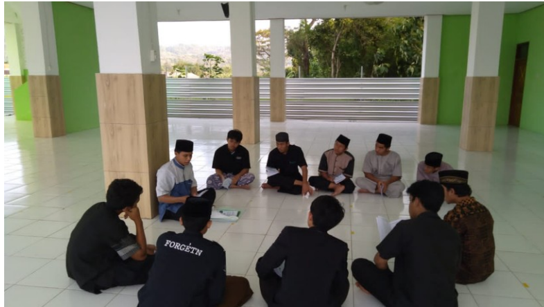
Gambar 1. Pengarahan penerapan metode halaqoh

dilakukan pendamping kepada pendidik di Taman Pendidikan Al-Qur'an Masjid Al-Ikhlas Purwosari, Gunung Kidul: