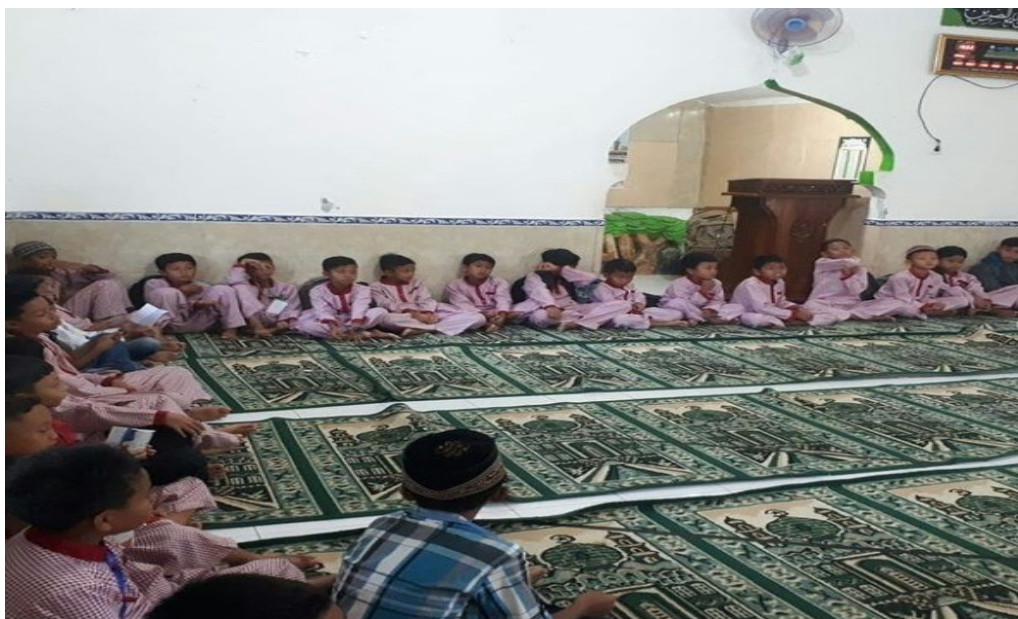
Gambar 3. Praktik metode halaqoh oleh pendidik kepada santri

Praktik metode halaqoh oleh Pendidikan kepada santri dilaksanakan di Taman Pendidikan Al-Qur'an Masjid Al-Ikhlash Purwosari, Gunung Kidul. Pada tahap ini, pelaksana pengabdian kepada masyarakat mengajarkan metode halaqoh, sesuai pengertian halaqoh terdiri dari seorang guru dan beberapa murid, bisa 5-10 murid. Posisi murid ialah melingkar sambil menyimak apa yang disampaikan guru. Lalu guru menyiapkan alat peraga untuk memudahkan guru untuk mengajar.