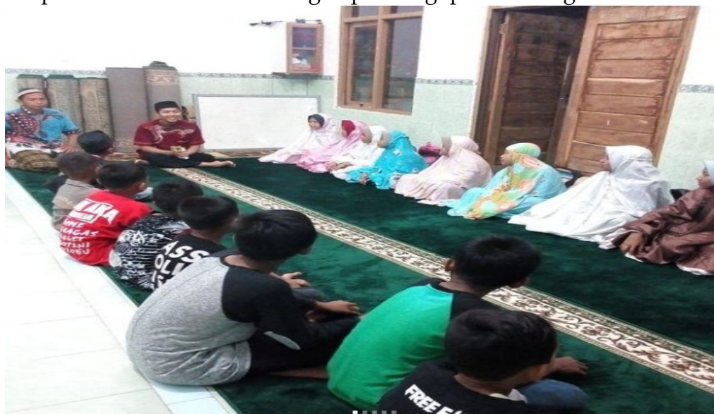
Gambar 6. Kelompok Halaqoh

Dokumentasi diatas menunjukkan adanya kelompok halaqoh yang dibagi berdasarkan tingkat usia. Dokumentasi diatas merupakan kelompok halaqoh dengan usia 4-6 tahun. Terlihat melalui pembagian seperti itu, para santri dapat berinteraksi sesuai dengan psikologi perkembangan usia 4-6 tahun.