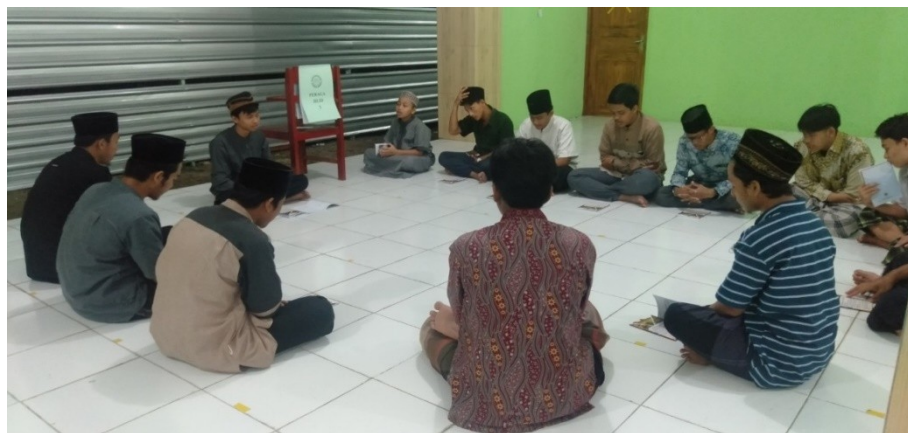
Gambar 2. Praktik metode halaqoh sesama pendidik

Dokumentasi diatas merupakan pengarahan untuk penerapan metode halaqoh yang akan diterapkan di di Taman Pendidikan Al-Qur'an Masjid Al-Ikhlas Purwosari, Gunung Kidul. Kegiatan ini merupakan tahapan pertama pendampingan para pendidik di Taman Pendidikan Al-Qur'an Masjid Al-Ikhlas Purwosari, Gunung Kidul. Selanjutnya, pendampingan dilakukan dengan pengarahan alat peraga yang dilakukan kepada para pendidik di Taman Pendidikan Al-Qur'an Masjid Al-Ikhlas Purwosari, Gunung Kidul: