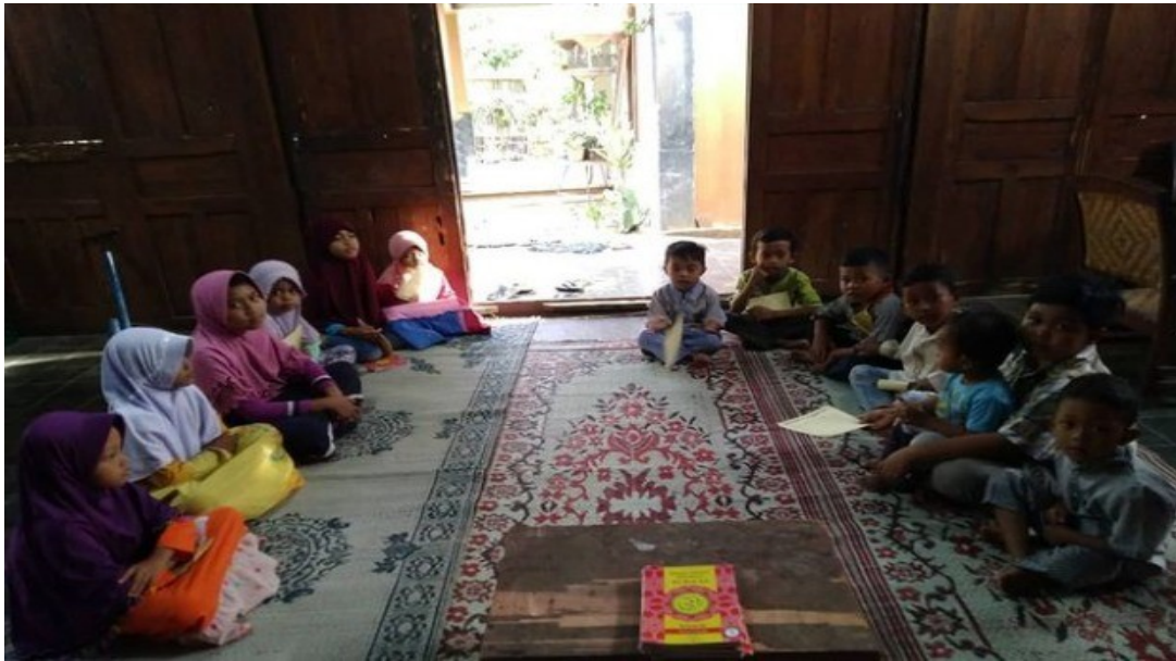
Gambar 5. Kelompok halaqoh berdasarkan tingkat usia

Dokumentasi diatas merupakan proses pengajaran para pendidik kepada santri di Taman Pendidikan Al-Qur'an Masjid Al-Ikhlas Purwosari, Gunung Kidul. Penerapan metode halaqoh di Taman Pendidikan Al-Qur'an Masjid Al-Ikhlas Purwosari, Gunung Kidul dilaksanakan dengan mempertimbangkan tingkat usia santri, sehingga pembagian kelompok kelaqoh didasarkan pada tingkat usia. Hal ini dilakukan untuk dapat mewujudkan lingkungan belajar yang kondusif (Hafidz & Nashihin, 2021) sesuai dengan kondisi psikologis para santri di Taman Pendidikan Al-Qur'an Masjid Al-Ikhlas Purwosari, Gunung Kidul.