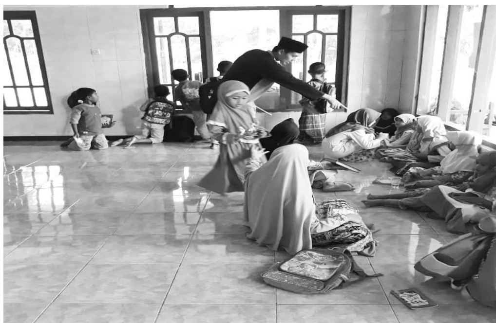
Gambar 4. Proses pengajaran kepada santri