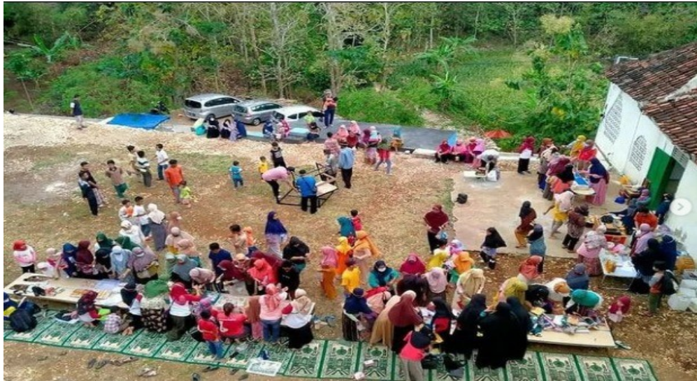
Gambar 8. Kajian rutin disekitar masjid

Berdasarkan dokumentasi tersebut diatas, sangat terlihat antusias dari warga sekitar Taman Pendidikan Al-Qur'an Masjid Al-Ikhlas Purwosari, Gunung Kidul untuk mengikuti kajian rutin yang dilaksanakan di sekitar masjid. Kondisi ini akan membuat komunitas pelaksana pengabdian kepada masyarakat dapat dibentuk dengan baik.