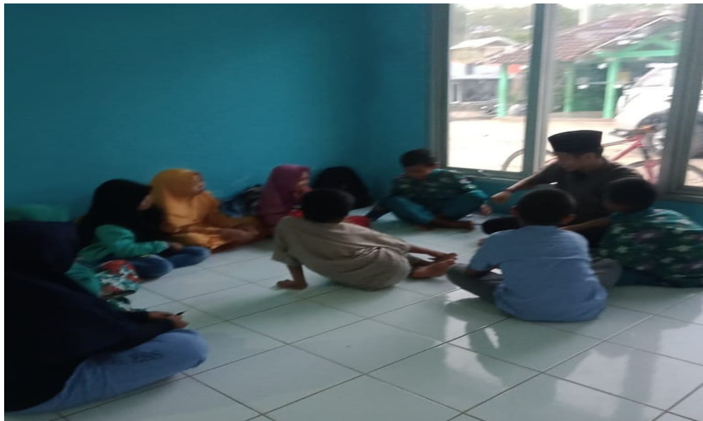
Gambar 7. Kondisi kelompok Halaqoh

Dokumentasi diatas menunjukkan kelompok halaqoh dengan usia 7-12 tahun. Pembagian kelompok halaqoh berdasarkan usia tersebut menjadikan kelas terlihat sangat kondusif. Pada kelompok halaqoh usia 7-12 tahun tersebut terlihat terdapat antusiasme para santri terhadap penyampaian materi kurikulum di Taman Pendidikan Al-Qur'an Masjid Al-Ikhlas Purwosari, Gunung Kidul.