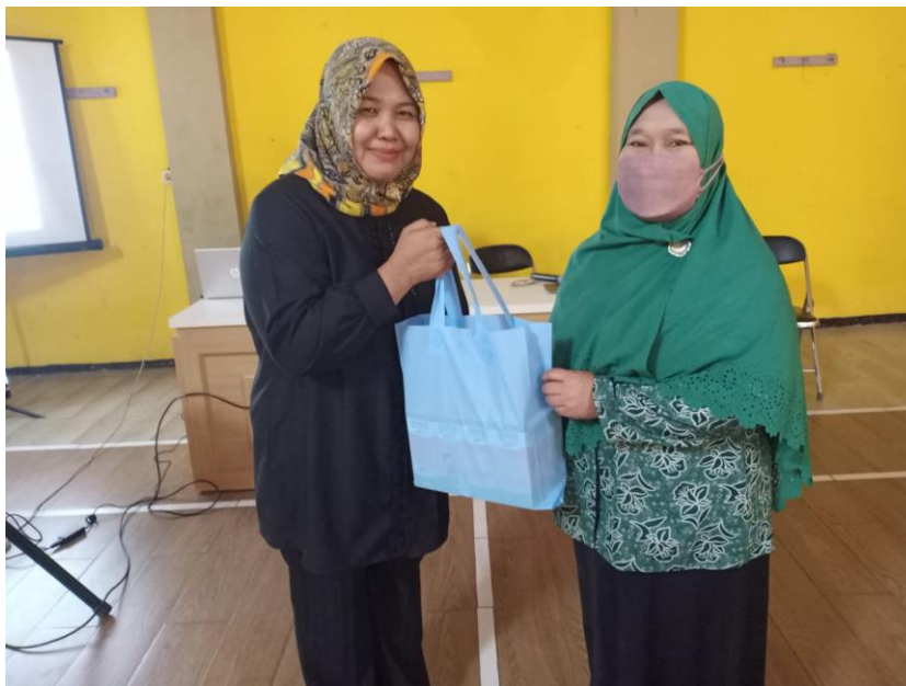
Gambar 4. Pemberian Bantuan Kepada Perwakilan Kelompok PKK