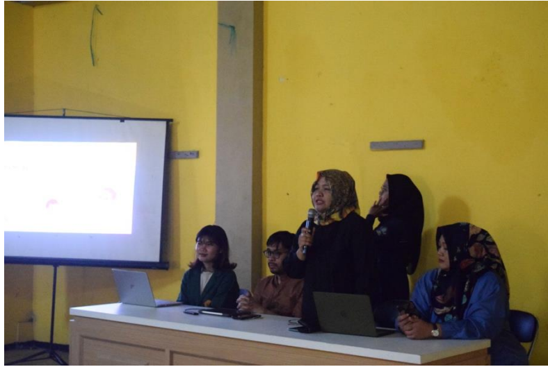
Gambar 2. Penjelasan Materi Oleh Tim PkM