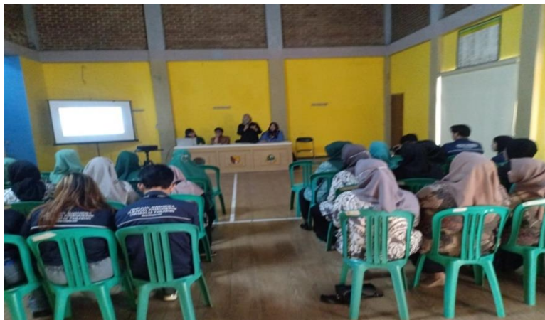
Gambar.1 Suasana Pelaksanaan PkM