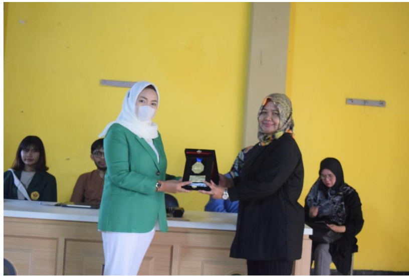
Gambar 3. Pemberian Kenang-Kenangan Kepada Kelompok PKK