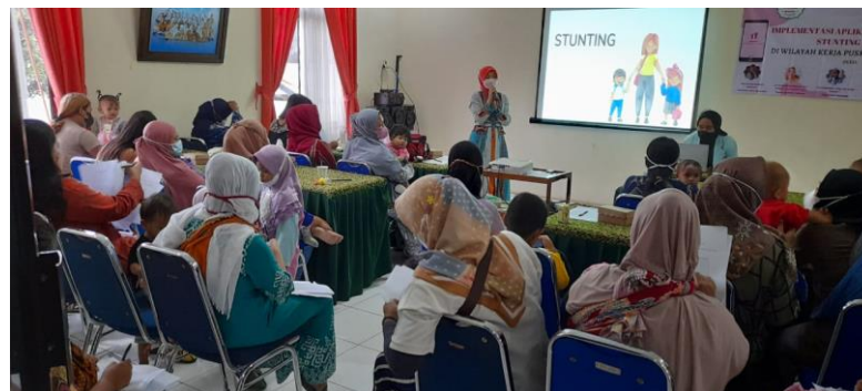
Gambar 2. Proses Penyuluhan Tentang Pencegahan Stunting

Berdasarkan Tabel 1 diketahui bahwa terdapat peningkatan pengetahuan tentang stunting setelah penyuluhan. Media ajar pada penyuluhan yang dilakukan menggunakan power point, serta leaflet. Pengetahuan yang baik terkait stunting serta bagaimana mencegahnya dapat menurunkan angka kejadian stunting (Sirajuddin et al., 2021).