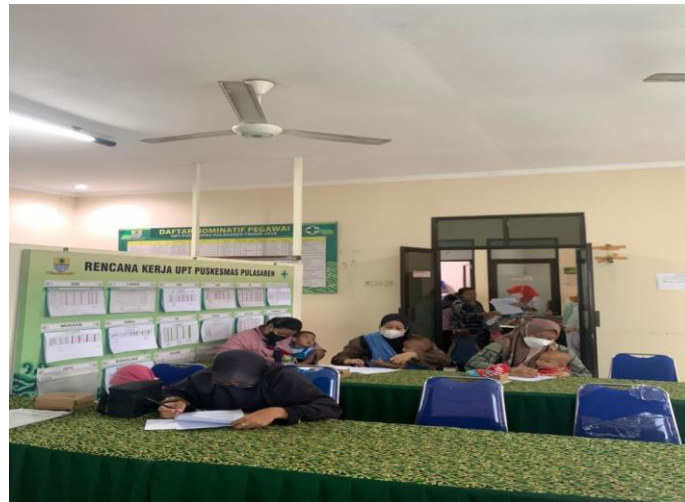
Gambar 1. Pemberian dan Pengisian Kuesioner

Hasil olah data dari kuesioner yang telah diisi oleh peserta dijelaskan melalui Tabel 1 :