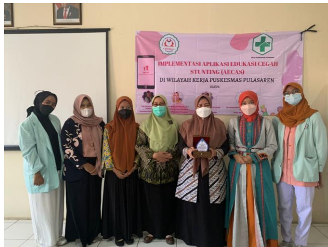
Gambar 3. Foto dan Komitmen Bersama Menekan Angka Stunting di Kota Cirebon

Selain memberikan materi dengan baik, nara sumber dan peserta berdiskusi. Peserta aktif bertanya dan mengikuti seluruh rangkain penyuluhan dengan baik. Sesekali ada peserta yang keluar ruangan untuk menenangkan balita yang menangis, akan tetapi dengan bantuan dari fasilitator ibu bisa tetap fokus mengikuti kegiatan dan tidak tertinggal materi yang diberikan. Fasilitator dalam penyuluhan ini adalah mahasiswa keperawatan yang sedang melakukan proses skripsi dan sudah terpapar dnegan materi pencegahan stunting sebelumnya. Setelah pengisian post test, tim dari STIKes Mahardika dan Puskesmas Pulasaren kemudian foto bersama sebagai pengingat akan komitmen bersama untuk menekan angka stunting di Kota Cirebon.