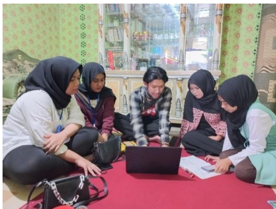
Gambar 3. Pendampingan penyusunan laporan keuangan

Masih banyak yang belum mengetahui pentingnya membuat laporan keuangan atau pembukuan akuntansi yang terstruktur secara rutin. Di sektor UMKM misalnya, masih banyak para pelaku UMKM yang belum mengerti cara menyusun laporan keuangan dengan tepat. Oleh sebab itu, kami melakukan pendampingan kepada UMKM tentang bagaimana cara menyusun pencatatan laporan keuangan sederhana yang baik agar keuangan dapat terkelola dengan baik. Karena pembukuan atau laporan keuangan ini adalah kunci dalam mengendalikan performa suatu usaha.