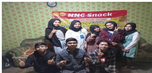
Gambar 5. Pembuatan banner untuk UMKM

Selain melalui Digital Marketing , penggunaan banner sebagai media promosi menjadi salah satu cara terbaik dan cukup mudah dalam menawarkan serta menginformasikan suatu usaha. Kami membuat banner untuk lebih memperkenalkan produk ke masyarakat sekitar dan mendapat perhatian lebih banyak dari para calon konsumen.