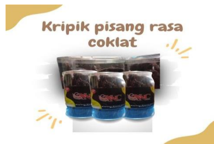
Gambar 4. Inovasi Produk

Produk inovasi adalah sebuah produk yang dikembangkan dari produk sebelumnya yang memiliki nilai perubahan dari segi rasa, bentuk, kombinasi atau hal lainnya. Hal ini dapat mengembangkan ide ide yang tertuang dalam terus menciptakan produk produk yang inovatif. Produk inovasi yang kami buat adalah keripik pisang rasa coklat, kami juga mengubah kemasannya yang semula menggunakan standing pouch kemudian diubah menggunakan toples.