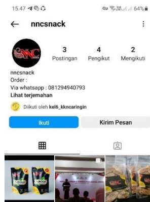
Gambar 2. Pembuatan Akun Instagram