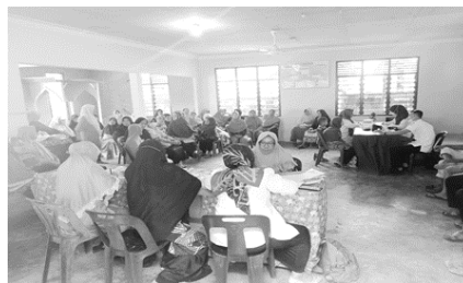
Gambar 1. Kegiatan Posyandu Lansia