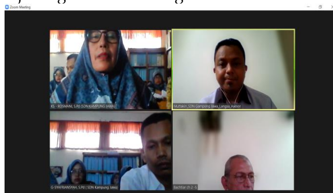
Gambar 4. Visitasi Akreditasi Daring

Visitasi ke SD Negeri Gampong Jawa dilakukan pada tanggal 28 Juni 2022. Berikut ini disajikan gambar bukti kegiatan: