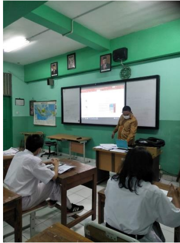
Gambar 1. Instruksi Siswa Penggunaan Pembelajaran Bahasa Inggris dengan Menggunakan Moodle

Setelah informasi diberikan, langkah selanjutnya adalah menarik kesimpulan. Setelah memaparkan berbagai informasi yang telah diterima, peneliti membuat hasil akhir dari suatu penelitian.