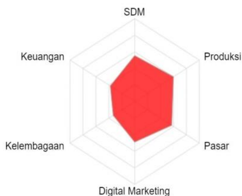
Gambar 2 Skema Jaring Laba-Laba

Dinas Koperasi dan UKM DIY telah melakukan pemetaan kondisi umum UMKM DIY berdasarkan 6 (enam) aspek yang bisa dipotret melalui jejaring laba-laba, yaitu: 1) aspek produksi; 2) aspek SDM; 3) aspek pemasaran; 4) aspek keuangan; 5) aspek kelembagaan; dan 6) aspek teknologi digital., sebagaimana tergambar dalam Tabel 2 (pengambilan data dilakukan pada Bulan Juli 2021):