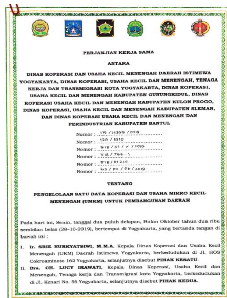
Gambar.3 Perjanjian Kerjasama