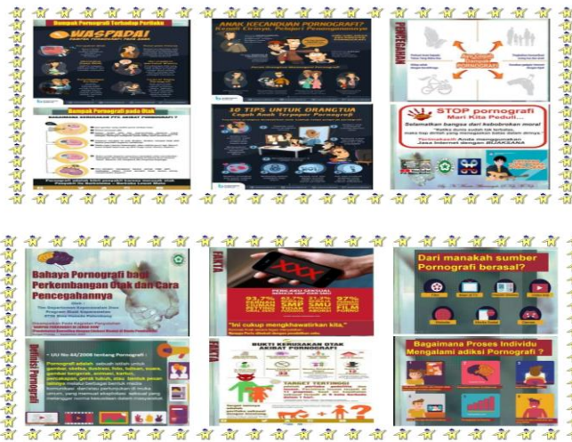
Gambar. 2 Kegiatan