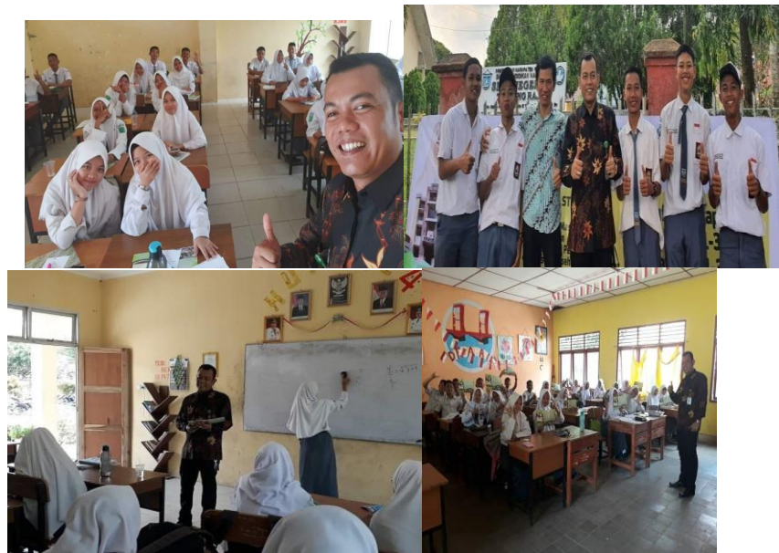
Gambar. 3 Dokumentasi kegiatan