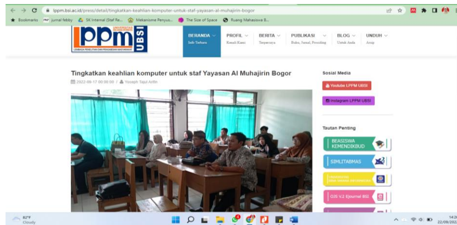
Gambar 4. Foto Pengabdian pada Artikel

Untuk hasil dari pengabdian ini berupa artikel mengenai pelaksanaan pengabdian kepada masyarakat telah terbit dan dapat diakses pada laman: https://news.bsi.ac.id/amp/2022/09/20/dosen-universitas-bsi-tingkatkan-keahlian-komputer-untuk-staf-yayasan-almuhajirin-bogor/ dan juga di website LPPM pada link: https://lppm.bsi.ac.id/press/detail/tingkatkan-keahlian-komputer-untuk-staf-yayasan-al-muhajirin-bogor