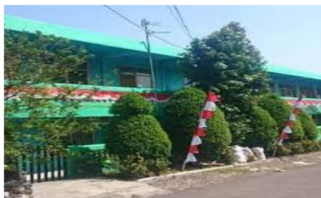
Gambar 2. Foto Depan Yayasan Pendidikan dan Kesejahteraan Islam Al Muhajirin Kota Bogor