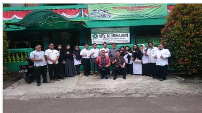
Gambar 3. Peserta Pelatihan