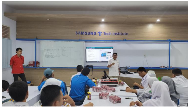
Gambar 1. Pemberian Materi