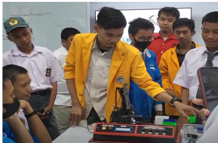
Gambar 2. Simulasi Pemrograman Robotika Menggunakan Mikrokontroler