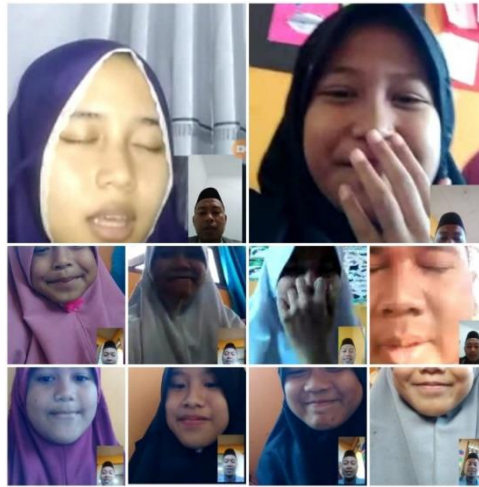
Gambar 1. Pelaksanaan Program Tahfidz dan Tahsin secara Online

Berdasarkan pada dokumentasi tersebut, maka dapat diketahui bahwa para peserta yang merupakan masyarakat Desa Ancaran Kecamatan Kuningan Kabupaten Kuningan mengikuti program Tahfidz dan Tahsin Al-Qur'an yang diselenggarakan tersebut dengan serius. Para peserta juga terlihat merasa enjoy melakukannya. Dengan demikian, program Tahfidz dan Tahsin Al-Qur'an melalui Pengabdian kepada Masyarakat di Desa Ancaran dapat terselenggara dengan baik hingga selesai.