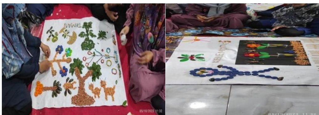
Gambar 2: Praktek Pemanfaatan media Loose Part

Selain itu, melalui PKM ini juga terjadi peningkatan kreativitas guru dalam mengembangkan materi pembelajaran menggunakan media Loose Part. Mereka mampu menghasilkan karya yang menarik, inovatif, dan sesuai dengan kebutuhan anak usia dini. Pemahaman tentang desain dan penggunaan media Loose Part juga memungkinkan guru-guru untuk menciptakan lingkungan pembelajaran yang lebih interaktif dan menyenangkan.