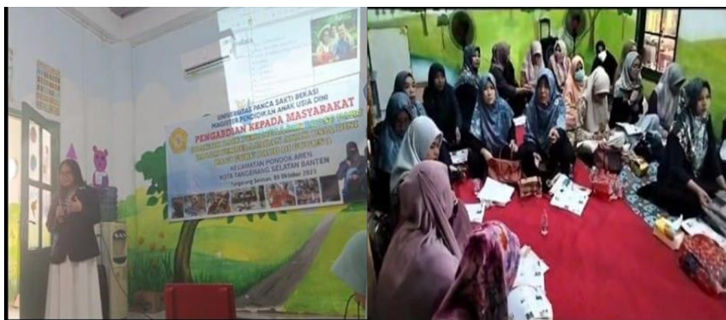
Gambar 1: Pemaparan materi Loose Part

Hasil PKM (Pengabdian Kepada Masyarakat) berupa praktik Baik yang dikemas dalam bentuk yang penyampaian materi dan Praktek memanfaatkan media Loose Part yang bertujuan untuk meningkatkan pemahaman guru gugus PAUD tentang media Loose Part adalah bahwa melalui program ini, pemahaman guru terhadap media Loose Part dapat meningkat secara signifikan.