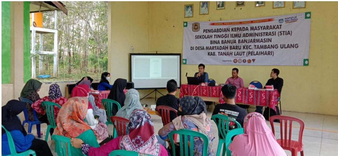
Gambar 4. Diskusi prioritas usaha BUMDes dengan Perangkat Desa, Pengurus BUMDes dan masyarakat