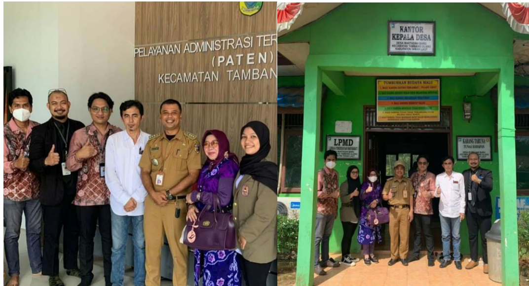
Gambar 1. Pertemuan awal dengan Camat Tambak Ulang dan Kepala Desa Martadah Baru, berdialog tentang potensi desa