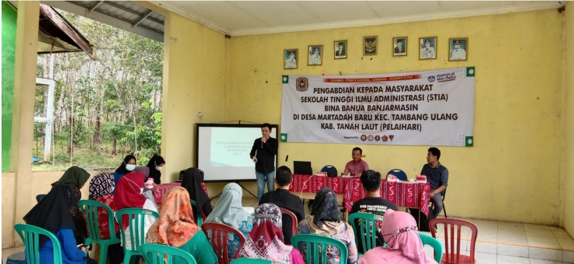
Gambar 3. Diskusi pemetaan potensi desa untuk peningkatan skala usaha BUMDes dengan Perangkat Desa, Pengurus BUMDes dan masyarakat

Berdasarkan studi awal dan FGD dengan pemangku kepentingan desa dapat dirumuskan beberapa faktor kunci yang penting untuk dipertimbangkan dalam kegiatan BUMDes Tritunggal Mandiri, sebagai berikut: