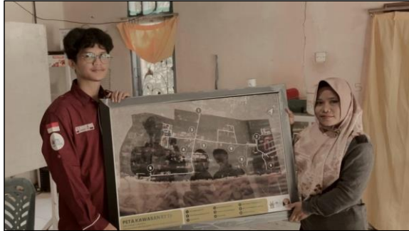
Gambar 3. Pemberian Peta Wilayah RT 19 dari Tim PKM ke RT 19