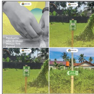
Gambar 5. Kegiatan Pemasangan Tanda Jalur Evakuasi dan Titik Kumpul

Selain pemetaan, Tim PKM ITK juga melakukan sosialisasi tentang mitigasi bencana kepada masyarakat RT 19 dengan pengisi materi pada kegiatan sosialisasi yakni Bapak Raftonado Situmorang, S.T., M.T. sosialisasi mitigasi bencana bermanfaat untuk meningkatkan pengetahuan dan kesadaran masyarakat tentang jenis, penyebab, dampak, dan cara mengurangi risiko bencana (Mulyani, dkk, 2010), serta mendorong partisipasi dan kolaborasi masyarakat dalam upaya pencegahan, kesiapsiagaan, tanggap darurat, dan pemulihan bencana (Aini, dkk, 2019).