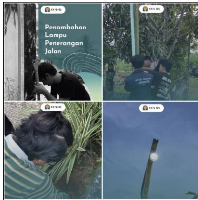
Gambar 10. Kegiatan Pembuatan dan Pemasangan Lampu PJU RT 19 Kelurahan Lamaru

Membantu menerangi jalan sehingga penglihatan pengguna jalan menjadi lebih baik dan mengurangi risiko kecelakaan (Rahman, dkk, 2018). Untuk meningkatkan keamanan dan kenyamanan masyarakat setempat, Tim PKM ITK memasang lampu penerangan jalan di wilayah RT 19. Lampu-lampu ini memberikan pencahayaan yang cukup untuk mencegah kecelakaan dan memberikan suasana yang nyaman pada malam hari.