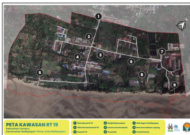
Gambar 2. Hasil Peta Wilayah RT 19 Kelurahan Lamaru

Tim PKM Institut Teknologi Kalimantan (ITK) melakukan pemetaan wilayah di RT 19 dengan tujuan memberikan informasi yang jelas tentang batas-batas wilayah tersebut. Pemetaan ini sangat penting dalam pengaturan pembangunan dan penataan wilayah yang lebih terorganisir. Dengan pembuatan peta wilayah ini masyarakat warga sekitar dapat mengetahui kondisi geografis daerah tersebut baik itu jalanan, tata letak rumah, perkebunan, tempat wisata, dan dapat melengkapi administrasi daerah tersebut serta memudahkan para mendatang untuk mengetahui daerah tersebut.