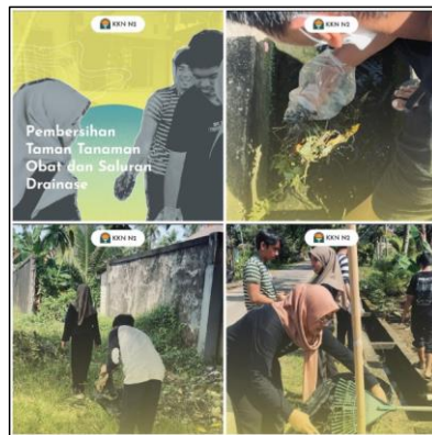
Gambar 9. Kegiatan Pembersihan Saluran Drainase RT 19 Kelurahan Lamaru

Pembersihan saluran drainase memiliki manfaat untuk mengalirkan air menuju pembuangan akhir sehingga mengurangi genangan air yang dapat menyebabkan banjir dan kerusakan jalan (Aini, dkk, 2019). Tim PKM ITK melakukan pembersihan drainase di sekitar wilayah tersebut, sehingga air dapat mengalir dengan lancar dan mengurangi risiko banjir. Bergotong royong membersihkan drainase bersama warga sekitar. Serta warga dapat melihat secara langsung bagaimana saluran drainase ini sangat berdampak sekali dengan banjir dan dapat memahami pentingnya kondisi drainase yang sempurna agar mencegah terjadinya penyumbatan aliran yang dapat berakibat pada terjadinya banjir.