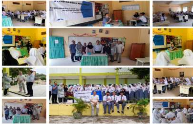
Gambar 2. Pelaksanaan Pengabdian Masyarakat

Kualitas SDM di Era 5.0, 4) Implementasi Ekonomi berbasis Syariah, 5) Promosi menuju Sekolah Islam Terpadu.