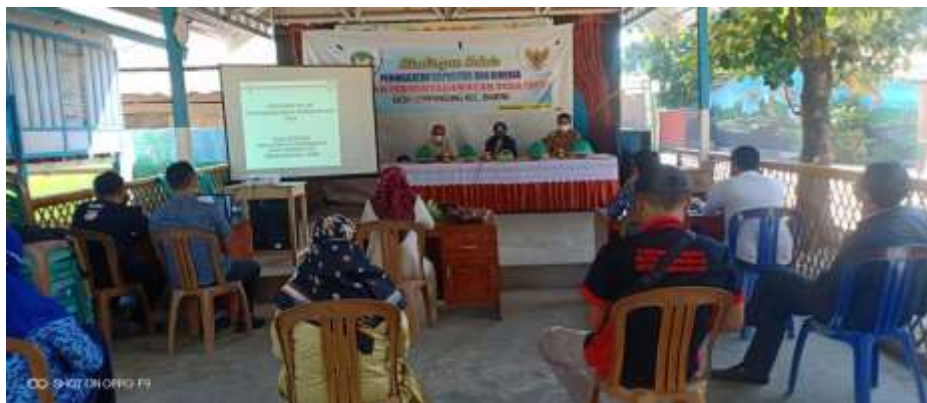
Gambar 2. Kegiatan Sosialisasi Aplikasi SISKEUDES

Melalui pengaturan beberapa modul tersebut diharapkan sistem dan prosedur pengelolaan keuangan desa secara rinci dapat diterapkan di setiap desa, sehingga mendorong desa menjadi lebih tanggap, kreatif dan mampu mengambil inisiatif menuju efisiensi. Dalam melaksanakan tugas, kewenangan, hak, dan kewajibannya dalam pengelolaan keuangan desa, kepala desa memiliki kewajiban untuk menyampaikan laporan. Laporan tersebut bersifat periodik semesteran dan tahunan yang disampaikan secara periodik kepada BPD terhadap pelaksanaan APB Desa yang telah disepakati di awal tahun dalam bentuk Peraturan Desa.