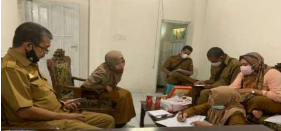
Gambar 4. Kegiatan Perencanaan Kegiatan Sosialisasi