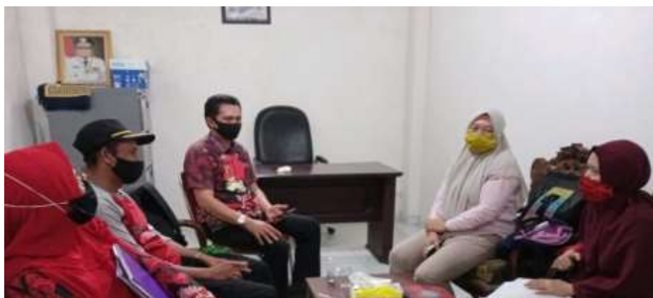
Gambar 3. Konsultasi dengan Pihak Pemerintah Desa dan Aparat