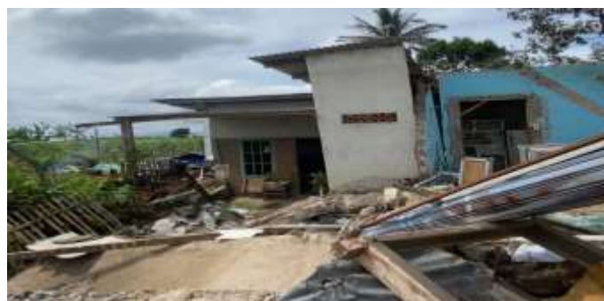
Gambar. 2 Kondisi Rumah Warga Mangunkerta yang Mengalami Kerusakan

Pada tahap pengkajian, dilakukan pemeriksaan kesehatan kepada masyarakat yang berada di tenda dan posko yang telah dibuat. Dari hasil pengkajian dan pemeriksaan fisik pada masyarakat sekitar wilayah desa Mangunkerta yang terdiri warga lokal dan relawan, masalah kesehatan yang ditemukan diantaranya: