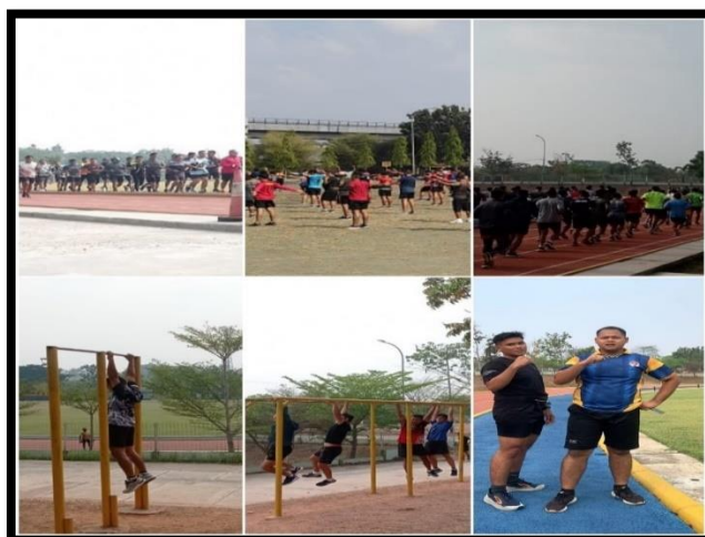
Gambar 3. Pelaksanaan Pengabdian Masyarakat

Berdasarkan Tabel 1. Rincian Kegiatan secara detail menjelaskan materi yang diberikan kepada calon siswa sekolah kedinasan di Jasdam II/Sriwijaya. Pada tahap pelaksanaan kegiatan pengabdian masyarakat ini berlangsung selama 6 hari.