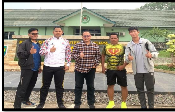
Gambar 4. Tim Pengabdian Masyarakat