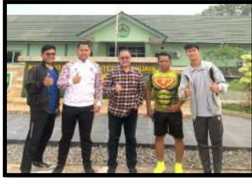
Gambar 4. Tim Pengabdian Masyarakat