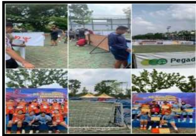
Gambar 3. Pelaksanaan Kegiatan Pengabdian Masyarakat

Berdasarkan Tabel 2. materi pengabdian masyarakat berfokus pada pendampingan kualitas sarana pada pada Kerjuaraan Nasional Street Soccer di Jasdram II Sriwijaya, adapun foto pelaksanaan kegiatan sebagai berikut: