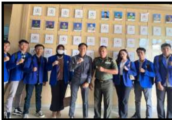
Gambar 2. Koordinasi dengan kajasdam II Sriwijaya

Kegiatan yang dilaksanakan pada tahap perencanaan antara lain 1) koordinasi kepada kepala Jasdram II Sriwijaya untuk mendapatkan ijin kegiatan, 2) survei kegiatan yang dilaksanakan di Jasdram II Sriwijaya 3) survai lapangan 4) tim pelaksana Kerjuaraan Nasional Street Soccer di Jasdram II Sriwijaya.