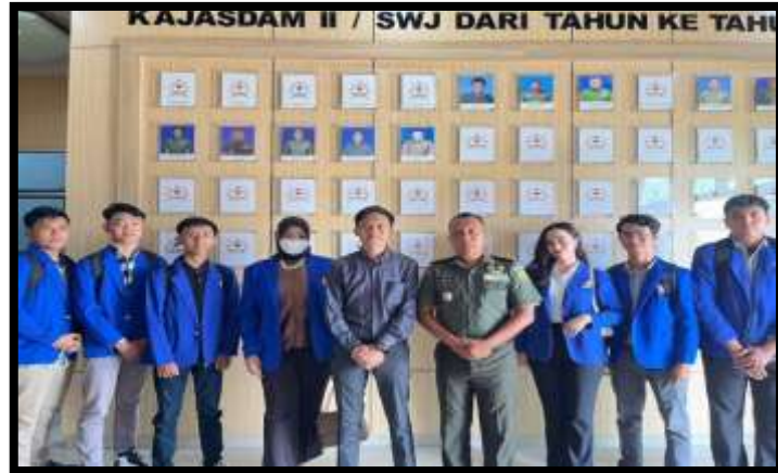
Gambar 2. Foto Bersama Kajasadam II/ Sriwijaya