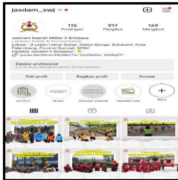
Gambar 4. Instagram Jasdram II/Sriwijaya

Tahap ini merupakan tahap penilaian yang berlangsung selama 4 bulan di Jasdram II/SWJ. Adapun hasil yang mana inovasi tim pengabdian masyarakat dalam mendesain konten story maupun feeds instagram menunjukkan peningkatan kunjungan yang datang ke Instagram Jasdram meningkatnya pengetahuan 100% pengelola humas di jasdram II Sriwijaya bukan hanya dari segi kunjungan tetapi dari pengikut (followers), tayangan, like, maupun penonton instastory Jasdram II/SWJ. Setelah dilaksanakan kegiatan pengabdian masyarakat ini tim pengabdian masyarakat memberi dampak positif dalam melakukan pengenalan kepada masyarakat.