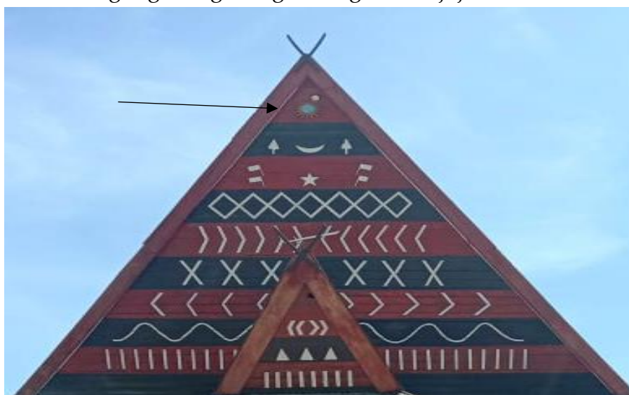
Gambar 2 : Mataniari

Menurut Mustari (2011:13-15), bahwa jujur adalah suatu perilaku yang didasarkan pada upaya menjadikan dirinya sebagai orang yang selalu dapat dipercaya dalam perkataan, tindakan, dan pekerjaan, baik terhadap dirinya maupun pihak lain. Kesimpulan kejujuran adalah hal baik yang ada dalam diri setiap orang dan dipergunakan untuk menyenangkan banyak orang. Berdasarkan tuturan berikut: pemerintahan, pelindung, adil mengaskan simbol matahari dalam bagas godang mengandung nilai kejujuran.