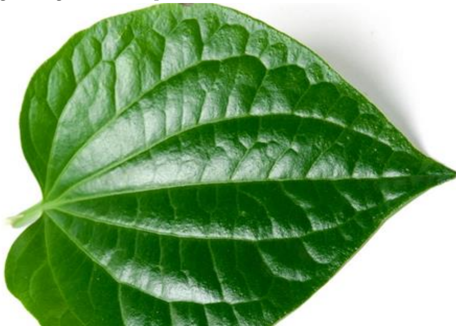
Gambar 1: Daun sirih

Menurut Zuriah (2007:139) bahwa kesopansantunan merupakan norma yang tidak tertulis yang mengatur bagaimana seharusnya bersikap dan berperilaku. Kesopansantunan mengacu dalam berperilaku berpakaian, berbicara, menghormati dan menghargai sesama manusia. Menurut Mustari (2014:129) bahwa santun adalah sifat yang halus dan baik hati dari sudut pandang tata bahasa maupun tata perilakunya kesemua orang. Kesimpulan, dalam tuturan berikut: meminta ijin, kepatuhan . Menegaskan bahwa simbol bagas godang mengandung makna kesopansantunan.