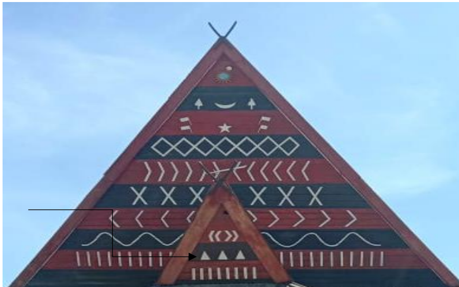
Gambar 3: rebung