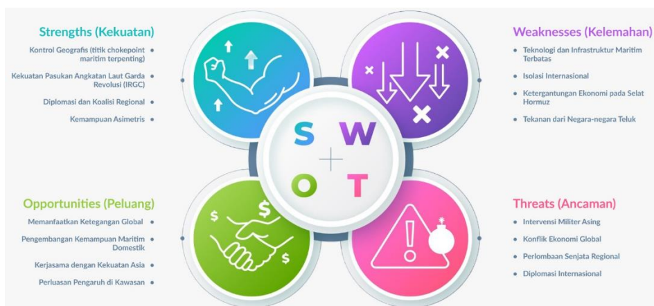
Gambar 2. Hasil Analisis SWOT Strategi Maritim Iran di Selat Hormuz

Hasil analisis menggunakan SWOT untuk menunjukkan strategi yang tepat dalam empat kategori (SO, ST, WO, dan WT) pada strategi maritim Iran di bawah kepemimpinan Tangsiri (Tabel 1) Analisis SWOT merupakan perencanaan strategis yang efektif untuk menganalisis pengaruh internal dan eksternal dalam suatu organisasi (A. Learnred et al., 1965) Analisis SWOT terdiri dari faktor internal dan eksternal. Faktor internal (kekuatan, kelemahan) digunakan untuk mengevaluasi aset dalam organisasi. Faktor eksternal (peluang, ancaman) digunakan untuk meneliti faktor-faktor di luar kendali organisasi yang mempengaruhi kinerja organisasi (TL. Wheelen dan J.D. Hunger, 1995; T. Hill dan R. Westbrook, 1997). Informasi yang diperoleh dapat diintegrasikan dalam kombinasi matriks dari keempat faktor ini untuk menentukan strategi bagi kemajuan jangka Panjang (Yuksel dan M. Dagdeviren, 2007)