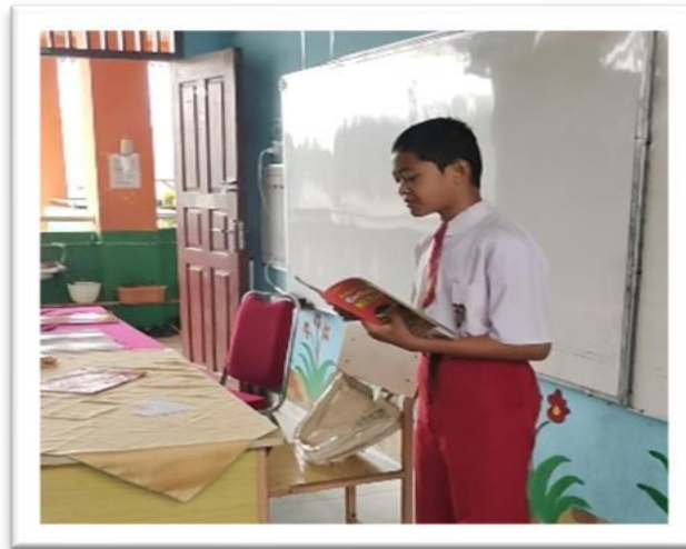
Gambar 6. Program Jurnal Baca

Selain hanya membaca program lain yang ditetapkan disekolah SdN 194 Pekanbaru ini yaitu setiap anak diwajibkan untuk membuat jurnal baca, anak diarahkan untuk membuat jurnal membaca yang berisi catatan atau dokumentasi catatan pengalaman, pemahaman, ataupun tanggapan siswa terhadap semua jenis buku yang telah dibaca, biasanya berisi rangkuman dari buku yang dibaca. Melalui jurnal membaca ini Sekolah berharap siswa mampu mengembangkan pemahamannya yang lebih mendalam terhadap apa yang dibacanya. Dan program jurnal membaca ini juga dibarengi dengan pemberian reward yang dilakukan di setiap akhir semester. Reward diberikan kepada anak yang rajin membuat jurnal baca, sehingga dengan pemberian reward ini anak akan termotivasi untuk lebih giat lagi membaca dan juga membuat jurnal bacanya. Pelaksanaan program ini sangat baik karena menanamkan sikap disiplin sejak dini dan terbukti dapat meningkatkan literasi sekolah, Contoh literasi anak sudah meningkat, bisa dilihat kalau anak tersebut berani tampil di depan kelas menceritakan kembali yang sudah dibaca.