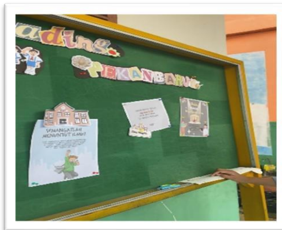
Gambar 2. Mading

Mading adalah sarana uantuk menyampaikan berbagai informasi tentang kegiatan Sekolah, melalui tulisan maupun gambar yang ditempel dipapan madding. Di SDN 194 pekanbaru juga memiliki madding yang diisi atau diperbaharui setiap minggunya. Dan untuk pengisian madding ini dilaksanakan