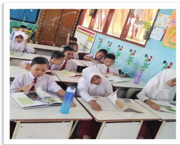
Gambar 5. Program Membaca 30 Menit