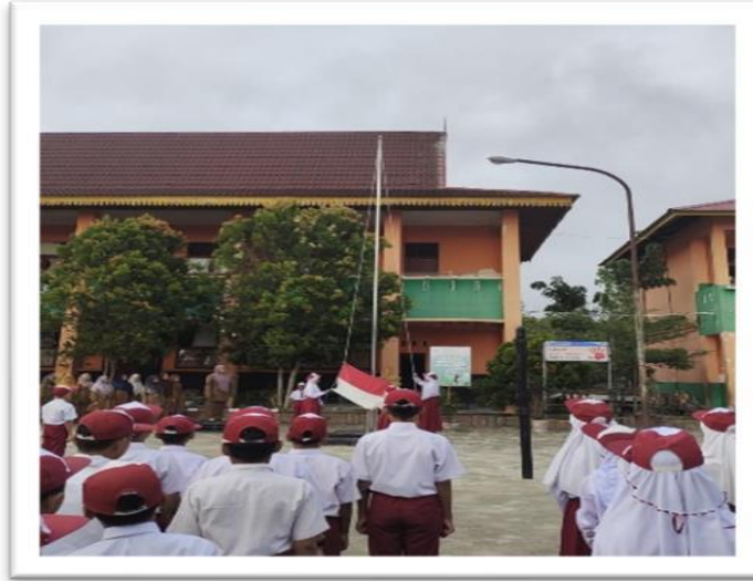
Gambar 4. Upacara Bendera

Upacara bendera adalah pelaksanaan upacara dengan bendera pusaka Indonesia di laksanakan setiap satu Minggu sekali yaitu di hari Senin. Kegiatan upacara ini juga memperkuat kesatuan bangsa, dan apabila di terapkan di sekolah membuat anak jadi punya kesatuan bangsa lebih menghargai teman dan cinta akan tanah air. Hubungan kegitan upacara dengan literasi yaitu saat upacara berlangsung anak akan mendengarkan amanat yang diberikan oleh guru, hal ini dapat meningkatkan literasi siswa dan melalui kegiatan upacara ini siswa diperkenalkan tentang simbol-simbol nasional, lagu-lagu kebangsaan, dan nilai patriotism kepada generasi muda. Siswa akan belajar tentang bagaimana menjadi seorang protokol, cara berpidato melalui amanat yang didengar, dan mampu meningkatkan keterampilan berbicara siswa didepan umum.