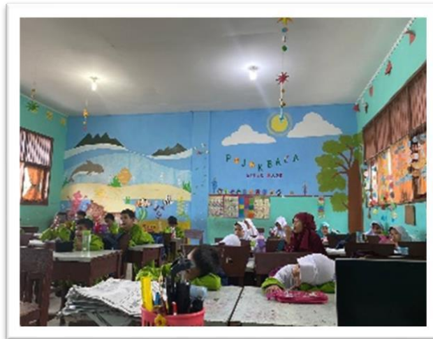
Gambar 1. Pojok Baca

Pojok baca merupakan sebuah tempat yang terletak di sudut ruangan yang dilengkapi dengan koleksi buku yang berperan sebagai perpanjangan fungsi perpustakaan. SDN 194 pekanbaru menjadi salah satu SD yang menyediakan pojok baca disetiap kelas untuk mendukung program literasi disekolahnya. Pojok baca ini disediakan di masing - masing kelas, mulai dari kelas 1 sampai kelas 6.