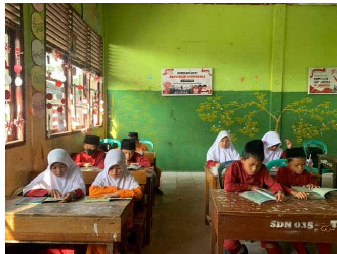
Gambar 1. Kegiatan Literasi 15 Menit

Di SDN 035 Tarai Bangun kegiatan membaca buku non pelajaran ini dilakukan setelah masuk kelas, kemudian setiap peserta didik memilih buku yang ingin dibacanya yang sudah tersedia di pojok baca, lalu peserta didik diberi waktu membaca selama 15 menit kemudian disuruh membuat rangkuman ataupun menceritakan apa yang sudah dibacanya. Ketika peserta didik belum mampu membaca dengan lancar, guru akan membimbing peserta didik dengan meminta mereka memahami gambar-gambar yang ada di buku. Selain itu, guru dapat membimbing peserta didik melatih keterampilan membaca dan menulisnya dengan menayangkan video. Hal ini dikarenakan dengan menonton video dapat meningkatkan kemampuan mendengar, melihat, dan menulis peserta didik, sehingga guru dapat mengetahui tingkat pemahaman peserta didik dan peserta didik dapat mengenal huruf melalui materi audio visual.