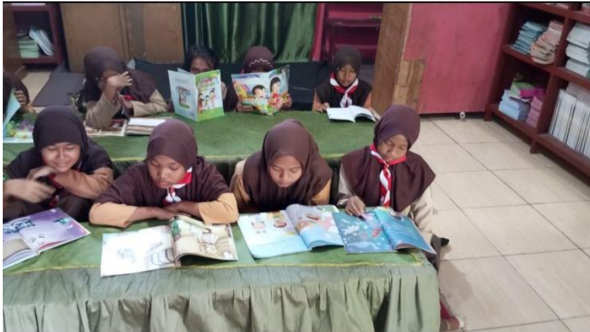
Gambar 3. Kegiatan Kunjungan Wajib ke Perpustakaan

Selain berperan untuk mendorong peserta didik menggunakan perpustakaan, guru juga dapat mendampingi peserta didik saat melakukan kunjungan perpustakaan, hal ini memungkinkan guru untuk memberikan bimbingan dan memotivasi peserta didik untuk membaca. Serta guru juga dapat menjadi role model, misalkan dengan guru menggunakan perpustakaan untuk menyelesaikan pekerjaannya disana, dengan begitu peserta didik akan termotivasi. Ini bisa di jadikan masukan oleh guru - guru yang ingin meningkatkan literasi peserta didik disekolah melalui memanfaatkan perpustakaan.