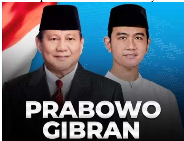
Gambar 1. Capres Cawapres Tahun 2024 Prabowo Gibran

Pemilu tahun 2024 di Indonesia merupakan tonggak sejarah dengan dilaksanakannya pemilihan secara serentak, yang mencakup Pemilihan Presiden dan Wakil Presiden, serta pemilihan anggota legislatif seperti anggota DPR, DPRD, dan DPD. Pemilu ini akan melibatkan lebih dari 204 juta pemilih yang tersebar di 38 provinsi, 514 kabupaten/kota, 7.277 kecamatan, dan 83.771 desa. Dalam konteks ini, terlibatlah 18 partai politik nasional dan 6 partai lokal Aceh. Pemilihan umum adalah salah satu pilar penting dalam demokrasi suatu negara, di mana masyarakat berperan aktif dalam menentukan arah dan pemimpin negara melalui proses politik yang diatur dalam siklus Pemilu setiap lima tahun. Pemilu tidak hanya sebagai cara untuk mengisi jabatan publik, tetapi juga sebagai implementasi prinsip-prinsip demokrasi, yaitu jujur, umum, rahasia, adil, dan langsung (jurdil). Sejak tahun 1998, Indonesia telah mengalami transformasi politik mendasar seiring dengan proklamasi sebagai negara demokrasi modern. Era reformasi ini menandai perubahan signifikan dalam kehidupan berbangsa, bernegara, dan berpolitik di Indonesia, di mana Pemilu menjadi salah satu simbol pelaksanaan hak daulat rakyat secara langsung.