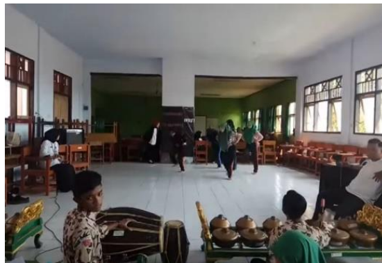
Gambar 4. Proses Karya Tari "Pesalakan"

Ekstrakurikuler tari UPTD di SMP Negeri 2 Bangkalan juga belajar menciptakan karya tari. Proses ini bertujuan untuk mengembangkan potensi sumber daya manusia dalam berkreasi bersama. Salah satu karya yang diciptakan oleh ekstrakurikuler tari UPTD SMP Negeri 2 Bangkalan adalah karya tari berjudul "Pesalakan". Proses kreatif ini juga memberikan manfaat bagi pembina/pelatih, sekolah, siswa, dan masyarakat. Manfaat dari proses kreatif ini sangat banyak dan bermakna seperti menambah koleksi karya, mempromosikan kegiatan ekstrakurikuler, dan juga asal daerah. Selain itu juga melatih mahasiswa untuk lebih bertanggung jawab, bertukar pikiran dan berkontribusi dalam kegiatan ekstrakurikuler.