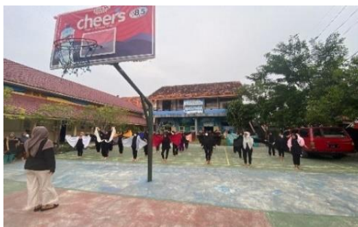
Gambar 3. Latihan Rutin Ekstrakurikuler Tari

Kegiatan ekstrakurikuler tari UPTD SMP Negeri 2 Bangkalan memiliki jadwal rutin untuk latihan yaitu setiap hari Kamis, pukul 15.00 di Lapangan basket UPTD SMP Negeri 2 Bangkalan. Dalam strategi pelestarian seni ekstrakurikuler memiliki tantangan dalam menerapkan metode-metode pelestarian seni kepada siswa UPTD SMP Negeri 2 Bangkalan.