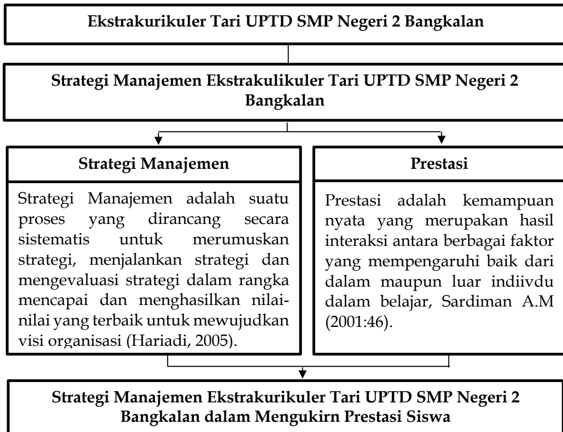
Gambar 1. Kerangka Berpikir