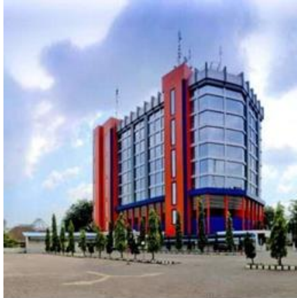
Gambar 2. Gedung Kantor Pusat dan Cabang Utama PT Bank Sumut

kantor pusat dan kantor cabang utama atau kantor lainnya akan tetapi harus dipisahkan antara kantor pusat dan kantor cabang utama. Hal ini dapat terlihat seperti gambar berikut yang merupakan Kantor Pusat dan Cabang Utama PT. Bank Sumut.