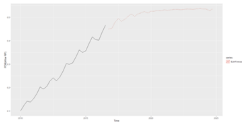
Gambar 1. Plot Data Training dan Data Prediksi PDB Indonesia