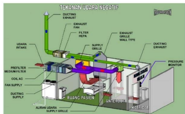
Gambar 1. Ruang Tekanan Negatif

Rumah Sakit Umum Daerah Dr. Soetomo Surabaya adalah salah satu rumah sakit di Indonesia yang telah menggunakan ruang tekanan negatif, ketentuan yang telah diberlakukan di RSUD Dr. Soetomo ialah ruang tekanan negatif harus memiliki sistem back-up listrik, sistem tata kelola udara harus dipastikan berkerja dengan baik, perbedaan tekanan udara ruang tekanan negatif dengan ruang lain minimal -15 Pa ( Pascal ), saluran udara dipastikan tidak ada yang bocor dan dipastikan udara keluar disaring menggunakan High Efficiency Particulate Air (HEPA filter) , dan ditambah sinar UV-C untuk membunuh mikroorganisme yang keluar (Gambar 1). Negative pressure room harus dilengkapi dengan: ruang anteroom , tempat cuci tangan hands free didalam anteroom dan ruang pasien, kamar mandi dengan WC dan wastafel didalamnya, menggunakan pintu dengan air lock system , menggunakan AC split duct , menggunakan exhaust fan .