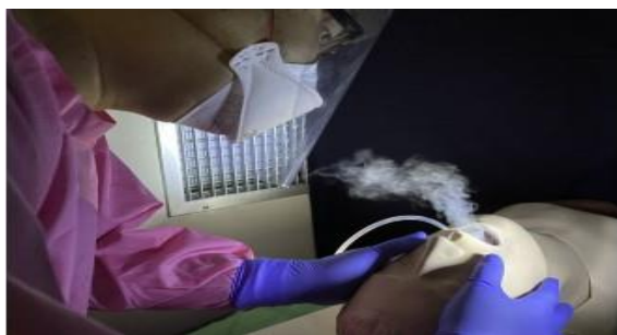
Gambar 3. Simulasi Menggunakan Nebulizer

Penggunaan ruang tekanan negatif pada klinik gigi dinilai akan meminimalisir terpaparnya dokter gigi dari aerosol yang dihasilkan dari proses perawatan. Braude dan Felming (2021) menegaskan bahwa pentingnya penempatan exhaust fan pada ruang tekanan negatif, Braude dan Felming melakukan percobaan menggunakan nebulizer untuk menghasilkan partikel aerosol didalam ruang tekanan negatif (Gambar 3). Braude dan Felming menemukan jika kepala pasien ditempatkan dekat dengan saluran buang dari exhaust fan , aerosol yang dihasilkan dari nebulizer akan langsung terhisap ke dalam exhaust fan , penggunaan ruang tekanan negatif bisa disimpulkan akan meminimalisir kontak dengan aerosol .