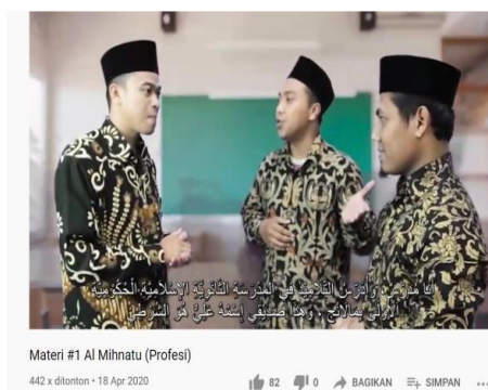
Gambar 3. Video Dalam Sistem Online

Dalam keterampilan mendengarkan, guru dapat menyediakan video pembicara asing dengan tema yang sesuai dengan rencana pembelajaran. Video yang disajikan dapat diambil dari sumber online seperti youtube, seperti gambar berikut.