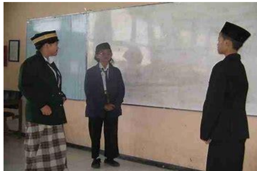
Gambar 4. Role Play Dalam Pembelajaran

Penerapan teori pembelajaran konstruktivistik dalam pembelajaran bahasa Arab dapat menggunakan beberapa metode pembelajaran, seperti penjelasan atau ceramah, tanya jawab, diskusi, penugasan dan role playing. Untuk contoh pada gambar berikut.