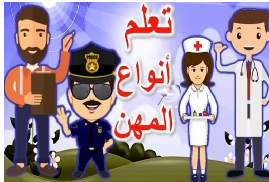
Gambar 2. Materi Pembelajaran

cara penulisan serta struktur kalimat yang digunakan dengan baik. Dalam keterampilan membaca dan berbicara, guru dapat memberikan siswa membaca dan berpikir kritis dengan meminta siswa untuk meneliti masalah di lingkungan mereka. Dalam hal ini siswa dapat mempresentasikan sebuah presentasi PPda deskripsi gambar, diagram, foto dan grafik. Salah satu instruksi dapat ditunjukkan pada gambar berikut.