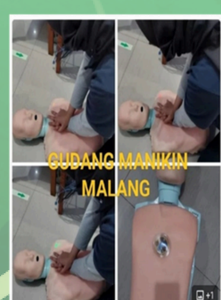
Phantom dan set BHD