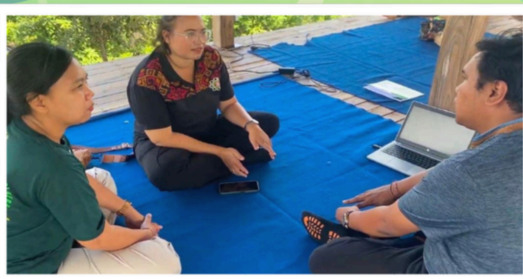
Pelatihan Pembuatan Konten Digital