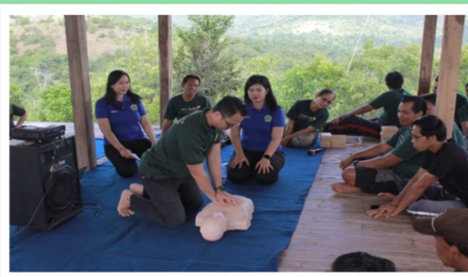
Pemberian Materi K3 dan Praktik Pelatihan BHD