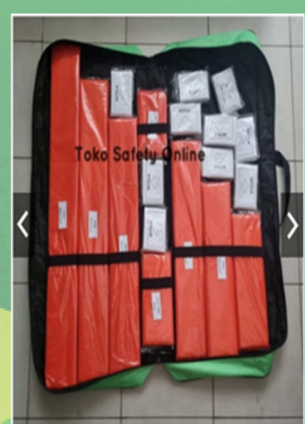
Set Bidai Kayu