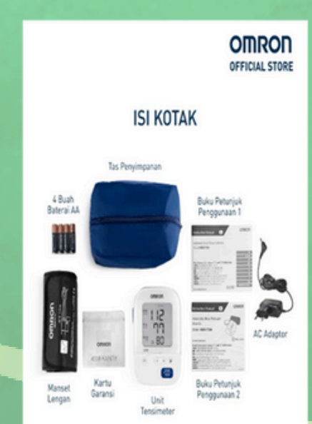
Tensi Meter digital

Terima kasih kepada Direktorat Jenderal Pendidikan Tinggi, Riset, dan Teknologi melalui Hibah Program Pengabdian Kepada Masyarakat tahun 2025 yang telah mendanai kegiatan ini, serta terima kasih juga disampaikan kepada STIKes Buleleng dan STIE Satya Dharma Singaraja