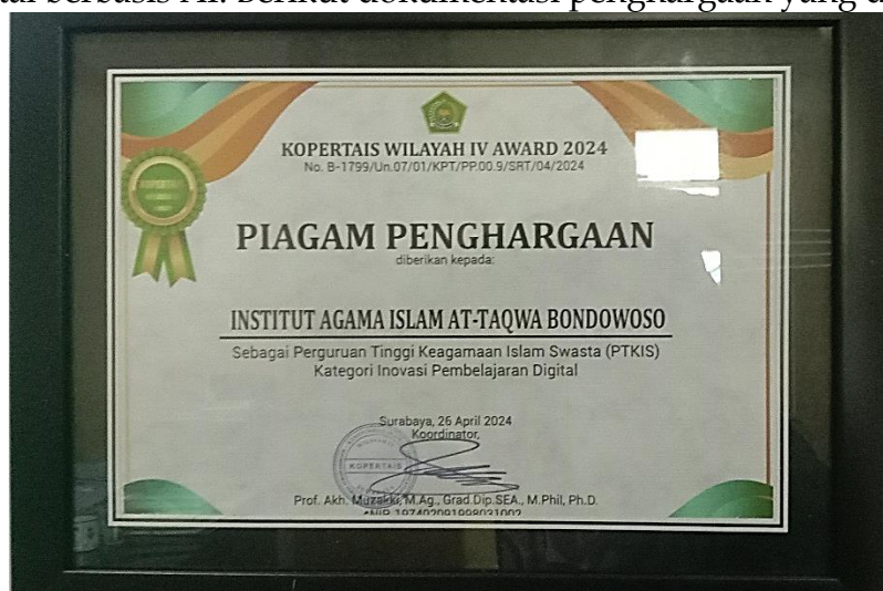
Gambar 2. Piagam Penghargaan

Temuan penelitian tersebut didukung juga dengan hasil observasi dan dokumentasi peneliti dilapangan mengenai komitmen Institut Agama Islam At Taqwa Bondowoso untuk benar-benar merealisasikan literasi digital berbasis AI dalam rangka mewujudkan mahasiswa yang berdaya saing global yaitu pada tahun 2024 telah memperoleh penghargaan sebagai perguruan tinggi keagamaan yang memiliki inovasi literasi digital sebagai dasar penyelenggaraan Pendidikan dilingkungan Pendidikan tinggi keagamaan. Penghargaan tersebut diberikan atas dedikasi, inovasi serta komitmen kuat Institut Agama Islam At Taqwa Bondowoso untuk mewujudkan mahasiswa yang berdaya saing global dengan memanfaatkan literasi digital berbasis AI. Berikut dokumentasi penghargaan yang diperoleh: