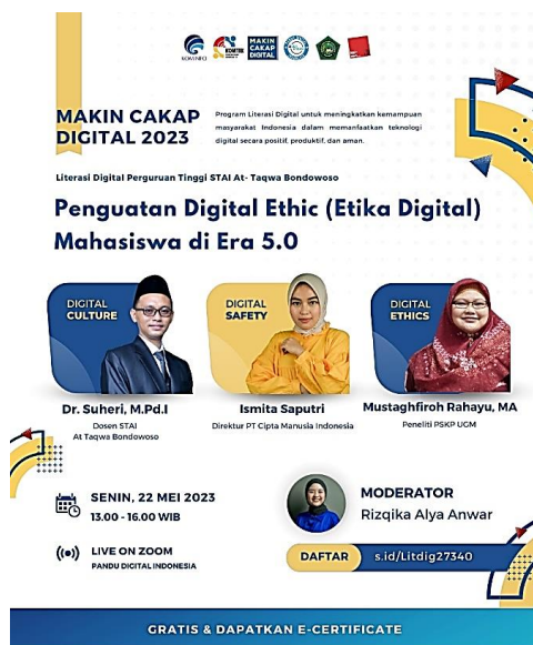
Gambar 3. Flayer Workshop

Keaktifan institusi Pendidikan tinggi dalam forum-forum akademik merupakan bentuk wujud komitmen peningkatan kemampuan adaptasi serta kompetisi akademis. Hal ini sangat penting dilakukan untuk menjawab tuntutan dunia global. Pernyataan ini disampaikan oleh guru besar pascasarjana universitas nasional Jakarta Lijan Poltak Sinambela (Sinambela, 2017).