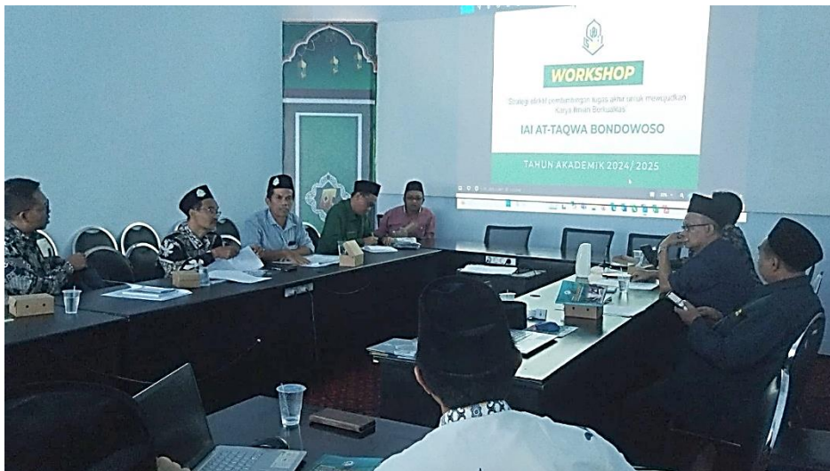
Gambar 1. Workshop Literasi Digital

“Salah satu strategi dalam mengoptimalkan kompetensi literasi digital dikalangan civitas akademik yaitu pelaksanaan workshop intensif yang diikuti oleh seluruh dosen di lingkungan Institut Agama Islam At Taqwa Bondowoso , workshop ini bertujuan untuk membekali para dosen untuk lebih adaptif terhadap perkembangan digital sebagai alat bantu dalam proses bimbingan kemahasiswaan”.