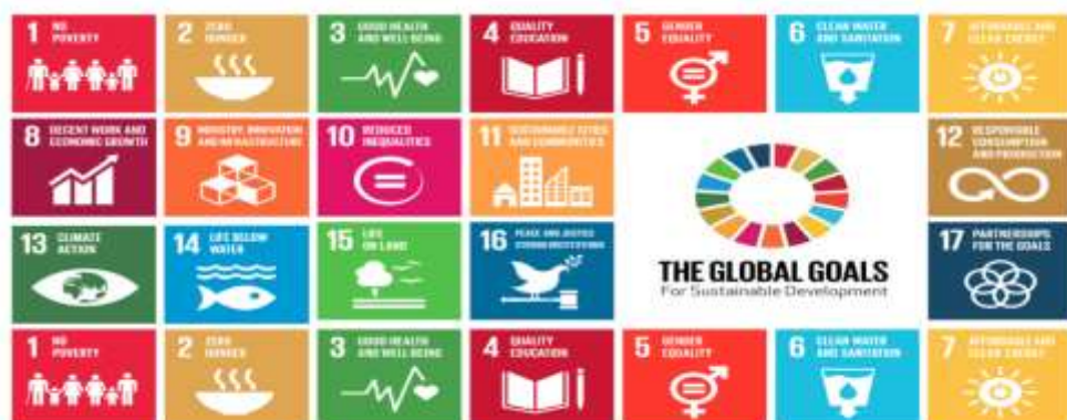
Gambar 4. Sustainable Development Goals

SDG's ( Sustainable Development Goals ) adalah resolusi yang diluncurkan oleh PBB pada ulang tahun Ke- 70 di New York Pada Tanggal 25-27 September 2023, meluncurkan new global Sustainable Development Goals , yang bertujuan menguatkan 3 unsur pokok yakni, ekonomi, sosial dan lingkungan.(Baeyens & Goffin, 2015) Department of Economic and Social Affairs menerangkan ada 17 Tujuan dari Program SDG's, yaitu:( The Goals SDG's , 2023)