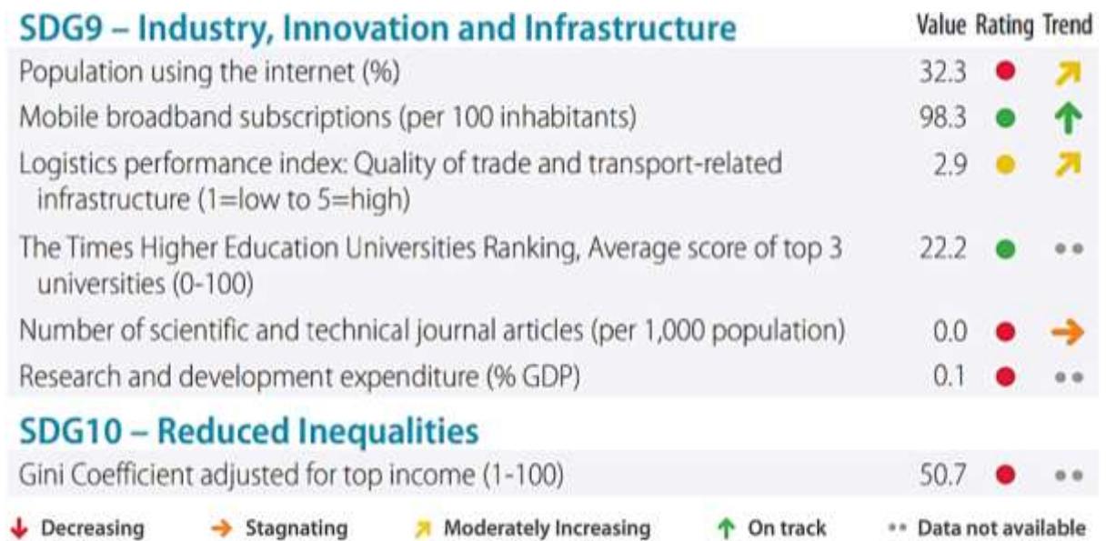
Gambar 3. Hasil Analisis Indeks 5 SDG's yang Berhubungan Dengan Ekonomi di Indonesia